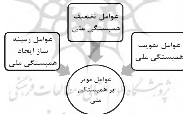
شکل ۱-۱ عوامل موثر بر همبستگی ملی [۱۴]

همبستگی ملی در ظرف دولت ملی، در جهان متغییر امروزی، که همواره در کشاکش دو سویه از ناحیه تمایلات و تعلقات فراملی و فروملی قرار دارد، از اهمیت پژوهشی و کاربردی فوق العاده ای برخوردار است [۱۲]. همبستگی ملی مفهومی دو سویه داشته که هم بر تمایزات و هم بر اشتراکات دلالت می نماید. این مفهوم از یک سو با تأکید بر مشترکات، ما را پیرامون محوری واحد همبسته و متعهد می سازد و از دیگر سو ما را از دیگران باز می شناساند. ایران ما کشوری متنوع، متکثر و مرکب از اقوام و خرده فرهنگ های گوناگون است که در میان آنها عناصر هویتی، دینی، ذهنی، تاریخ مشترک و جغرافیای واحد از اهمیتی بسیار برخوردار است. بنابراین هنگام بررسی همبستگی و هویت ایرانی باید با ظرایف خاصی از گذشته پیش از اسلام تا تماس با تمدن غرب در دوره های اخیر را مد نظر قرار داد و از افراط و تفریط و یک سو نگری جلوگیری نمود [۱۳]. در ادامه با عنایت به چارچوب مفهومی، عوامل تقویت، تضعیف و زمینه ساز همبستگی ملی در ایران مورد بحث قرار می گیرد.