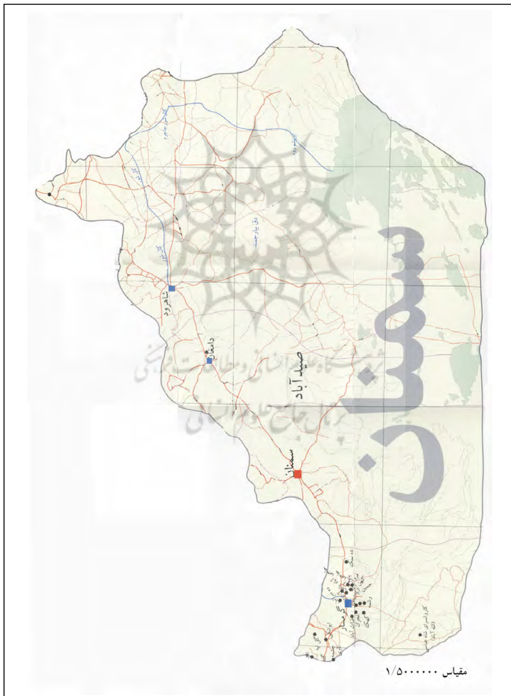
شکل شماره ۱: روستاهای شهرستان گرمسار

حیات جامعه شهرستان که بیش از ۷۰ هزار نفر است وابسته به رودخانه جبله رود است. زیرا چاه‌ها و قنوات دشت نیز که در ناودیس جنوب مخروط افکنه قرار گرفته‌اند تحت تاثیر تغذیه و آبدهی رودخانه فوق با دبی متوسط دوپست و پنجاه میلیون متر مکعب در سال ۸۰ درصد آب کشاورزی و آب آشامیدنی و بهداشتی را تامین می‌نماید. شهرستان گرمسار از دیرباز به عنوان قطب کشاورزی مطرح بوده است و ۸۴ روستای دارای سکنه داشته و طبق سرشماری سال ۱۳۸۵ دارای ۷۷۶۷۶ نفر جمعیت بوده که از این تعداد ۵۴۲۴۶ نفر در شهرهای گرمسار و ایوانکی و آرادان و ۲۳۴۳۰ نفر در روستاها زندگی می‌کرده اند یعنی ۶۹/۸ درصد ساکنان شهرستان، شهرنشین و ۳۰/۲ درصد روستائی هستند.