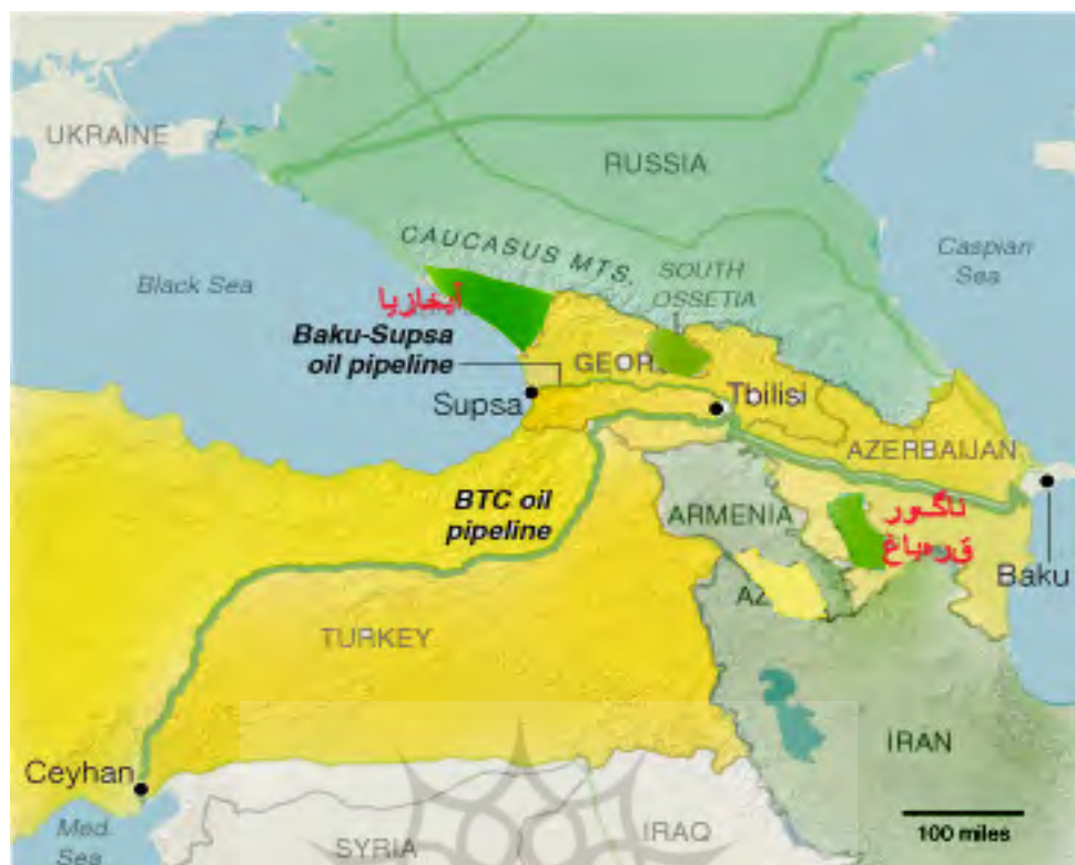
نقشه ۲- قدرت‌های رقیب منطقه‌ای