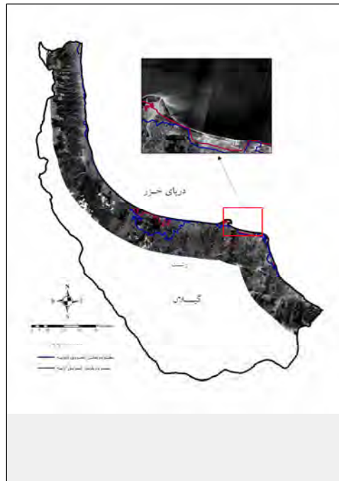
شکل ۲: موقعیت محدوده حایل عمودی اولیه و ثانویه در استان گیلان