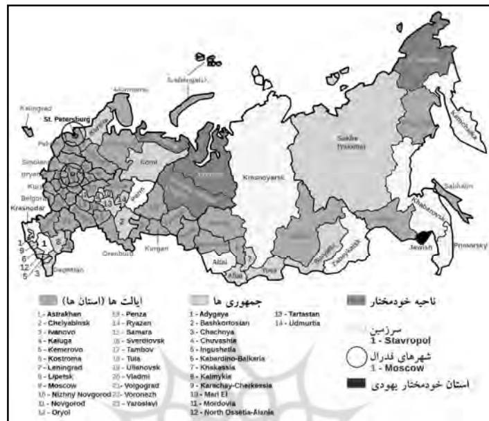
نقشه تقسیمات کشوری فدراسیون روسیه

منطقه یا ناحیه فدرالی شامل منطقه شمال غربی (مرکز: سن پترزبورگ)، منطقه مرکزی (مرکز: مسکو)، منطقه ولگا (مرکز: نیژنی نووگورود)، منطقه جنوبی (مرکز: راستوف آن دن)، منطقه خاور دور (مرکز: خاباروفسک)، منطقه اورال (مرکز: یکاترینبورگ)، منطقه سیبری (مرکز: نوواسیبیرسک) و منطقه قفقاز شمالی (مرکز: پیاتیگورسک) تشکیل می شود.