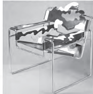
تصویر ۲- محصولات صنعتی طراحی شده توسط آلساندرو مندینی.

مثل سازه‌های فلزی را که احساس سردی و تیرگی و ترس را القا می‌نمایند با تصاویر بصری معناگرا، دلپذیر و قابل استفاده در موقعیت‌های مختلف، جایگزین نمود (Mendini, 2000, 45).