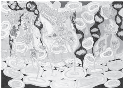
تصویر ۶- شوشاهادوبینز، برکه سبز ۱۸×۲۳ گواش روی مقوا، موزه گوگن هایم، نیویورک.