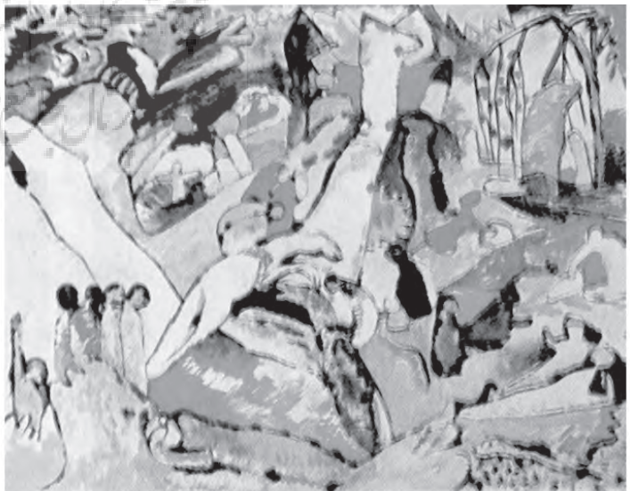
تصویر ۱- واسیلی کاندینسکی، ترکیب برای شماره ۳- ۱۹۱۰ رنگ و روغن روی بوم ۱۲۵/۵ × ۹۶، موزه سالمون کوکنهایم، نیویورک. ماخذ: (آرناسن، ۱۳۶۷، ۱۶۸)

از فلاسفه معاصر که در خصوص اهمیت عنصر خیال در خلاقیت هنری نظراتی ارائه کرده است، "بندتو کروچه" می باشد. این فیلسوف ایتالیایی در این باره می گوید: «خاصیت مشخصه هنر خیالی بودن آنست (همچنانکه وجه امتیاز شهود را از ادراک بوسیله مفاهیم و وجه امتیاز هنر را از فلسفه و از تاریخ و از بیان کلیات معقول و از مشاهده و نقل وقایع همین خیالی بودن دانسته اند) و به مجرد آنکه این صفت خیالی بودن جای خود را به تفکر و قضاوت بدهد، هنر از هم فرومی ریزد و می میرد» (کروچه، ۱۳۸۴، ۶۶).