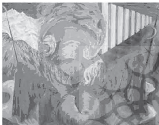
تصویر ۷- کارل یونگ، در انتظار ظهور، ابعاد ۳۵×۴۵، اکریک روی مقوا، گالری دیفورست، آشلند آمریکا.

دستاوردهای هنرمندان قرن بیستم غرب بود. گرچه این شیوه گوشه کوچکی از جریان بداهه‌سازی معاصر را اشغال می‌کند، اما تجربه‌ای است که برخی هنرمندان چون اوسکار دومینکس در سال ۱۹۳۶ به آن پرداختند. این شیوه هم اکنون در بین برخی از هنرمندان اروپائی رواج دارد که در اغلب موارد نیز تا حدی با دخل و تصرف هنرمند در اشکال ظاهر شده همراه است.