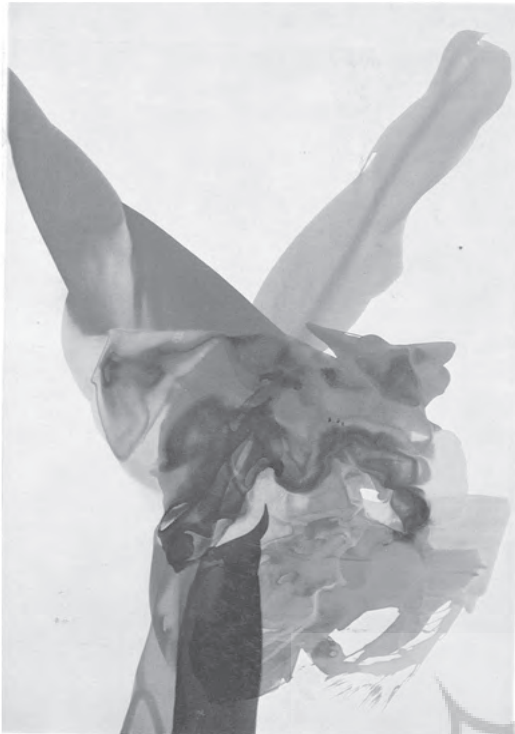
تصویر ۲- پل جنکین، پدیده اشارت اخروی - ۱۹۶۴- اکریلیک روی بوم - ۲۰۰ × ۲۹۰ مجموعه آقا و خانم هری و اندرسن - نیویورک ماخذ: (جانسن، ۱۳۷۴، ۵۱۵)

این خصوصیت خیالی و خیالی نگاری ناب، بخصوص در تجربیات انتزاع گرایان، شاید از مهمترین کشف و شهود هنرمندان بداهه نگار در قرن بیستم باشد. این نگرش و بداعت در هنر نوین از جمله بداهه سازی نتیجه تلاش و کوشش و نوآوری های هنرمندان مختلفی بود که در ظرف زمانی دوره معاصر با فاصله بسیار اندک از یکدیگر فعالیت می کردند. در تجربه ها و آزمایشگری های هنرمندان در اواخر قرن نوزدهم و اوایل قرن بیستم، هدف اصلی رسیدن به هنری بود که با اتکا به برداشت های آنی (مستقیم یا غیر مستقیم) از طبیعت، عناصر طبیعی در آن استحاله یافته، یا کاملاً حذف و یا توجه عین به عین هنرمندان به آن به حداقل رسیده باشد. از میان هنرمندانی که تلاش زیادی برای رسیدن به این هدف نمودند، می توان از کاندینسکی در آلمان، کوپکا و دلونه در فرانسه نام برد؛ این هنرمندان تلاش داشتند با سازماندهی عناصر هنری، چون رنگ، خط، فضا و امکاناتی که این عناصر ایجاد می کنند، آثار خود را خلق نمایند (تصاویر ۱، ۲، ۳).