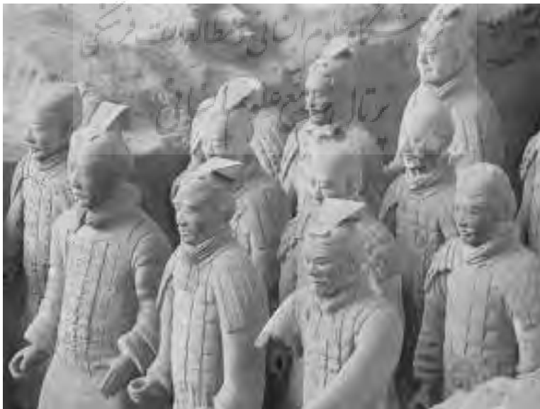
تصویر ۴- شخصیت پردازی در سربازان سفالی.

این مجسمه ها دارای ویژگی های خاصی در نمایش شخصیت افراد هستند، به گونه ای که گفته می شود: "با مفاهیم شخصیت پردازی نزد چینیان مطابقت دارند، زیرا پیش از آنکه در بند فرم انسانی باشند به شخصیت او علاقه نشان داده اند" (تریگیر، ۱۳۸۲، ۷۲) (تصویر ۴).