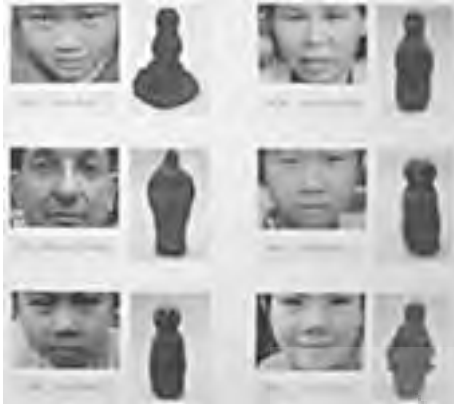
تصویر ۹- مفهوم شخصیت پردازی در پیکره های دشت آسیایی.

کوچک و ساده مشاهده کرد. موید این مسئله، دشت آسیایی به نمایش در آمده در توکیو است، که به عنوان تصویری منحصر به فرد از عشق و شخصیت هر یک از سازندگان، تصویر آنها نیز به همراه دشت به نمایش در آمد" (www.ukishima.net) (تصویر ۹).