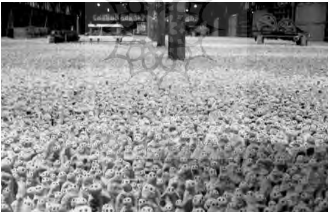
تصویر ۵- دشت آسیایی، ۲۱۰۰۰ مجسمه گلی ساخته شده با همکاری ۳۵۰ نفر از مردم با سنین متفاوت، چین، روستای شیانگ شان، شمال شهری در لونگ چو در جنوب چین.

بدون شک یکی از مهیج ترین و شگفت انگیزترین آثار گورملی که توجه بسیاری را به خود جلب کرده، اثر دشت او می باشد. گورملی برای اولین بار این اثر را در مکزیک به کمک مردم محلی ساخت، و به خاطر آن در سال ۱۹۹۴ برنده جایزه ترنر ۱۵ شد.