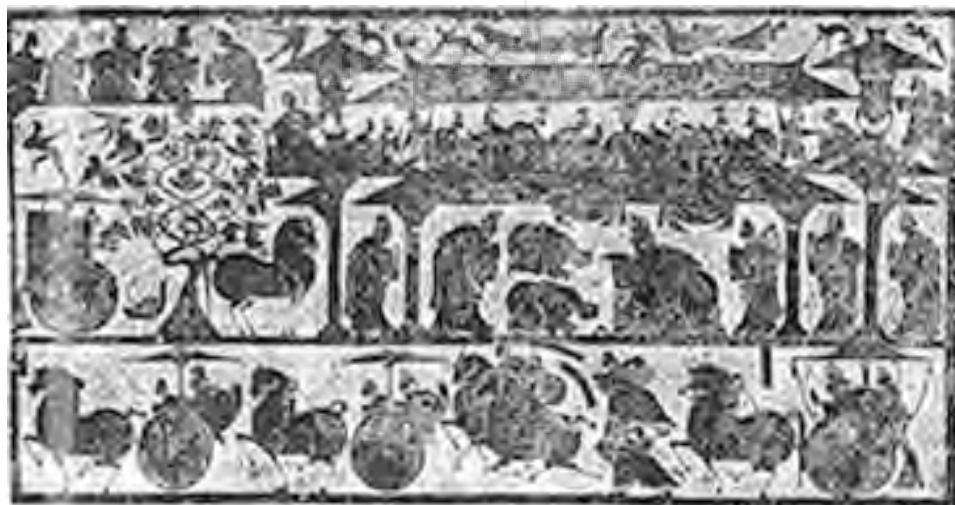
تصویر ۱- صحنه های اسطوره ای، مقبره وو، شانتونگ، سلسله هان ۱۶۸ م، نقش برجسته صیقل کاری شده سنگی. طول: - پسین، ۱۴۷، تقریباً ۱۵۰ سانتیمتر. ماخذ: (گاردنر، ۱۳۸۵، ۷۰۷)

هدف سازندگان مجسمه های سفالی جان بخشیدن و به صورت واقعی نشان دادن آنها بود. از نظر آنها هر چه مجسمه کامل تر و واقعی تر باشد در جهان دیگر به مردگان کمک بیشتری خواهد کرد. این مجسمه ها بیش از هر نوشته ای زندگی اجتماعی ادوار مختلف، نوع پوشش، زیبایی و سلاح های سربازان را نشان داده است، و چنان با ظرافت اند که حتی می توان نمونه ای از نژادهای مختلف را در میان آنها شناسایی کرد. "در واقع همه این مشاهدات، مهارت ها و احساسات هنرمندان، صرف هنری می شد که هرگز برای زندگان نبود، در ادبیات نیز آن را نادیده می گرفتند و تا همین اواخر تقریباً فراموش شده بودند. از قرن پنجم تا قرن دهم میلادی چینیان هنر تجسمی را به کمال رساندند و آن را در