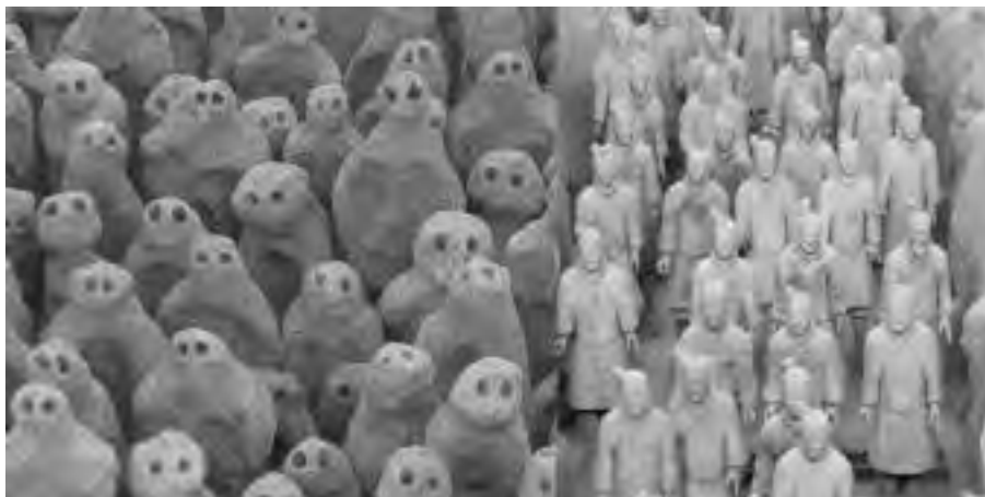
تصویر ۸- مقایسه ارتش سفالی چین و دشت آسیایی - نمای نزدیک.