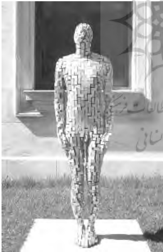
تصویر ۶- مکعب انسانی، بلاک‌های فولادی ۵۰x۲۵x۲۵mm کانادا، ارتفاع ۱۸۶cm X ۴۹ X ۳۴، ۲۰۰۲، از سری آثار بلوکی.

اثر دیگر گورملی که در این قسمت به آن می‌پردازیم، مکعب انسانی است (تصویر ۶). این مجسمه از سری کارهای او به نام آثار بلوکی ۲۰ است، که گورملی آن را در سال ۲۰۰۲ ساخت. این سری مجسمه‌ها که از بلاک‌های فولادی ساخته شده‌اند، به صورت واحدهای تکرار در سرتا سر مجسمه به کار رفته‌اند. گورملی در راستای کارش با فرم‌های انسانی، در این مقطع آنها را با واحدهای تکرار و روش ساختمانی بیان کرد. این اثر هم اکنون در حیاط موزه‌ای ۲۱ در کانادا نصب شده است (www.antonygormley.com).