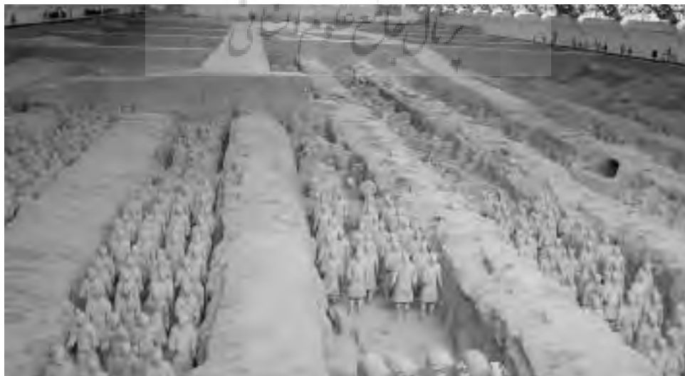
تصویر ۳- ارتش سفالی چین، مقبره چین شی هوانگ دی، شانسی، سلسله چین (۲۰۶-۲۲۱ ق م). ماخذ: (Jones, 2004, 32)

همانطور که در سطور فوق ذکر شد، مجسمه سازی مقابر برای جهان مردگان و خدمت به آنها در زندگی پس از مرگ به کار می رفت. بدون شک حیرت انگیزترین و باشکوه ترین این آثار، ارتش سفالی مقبره امپراطور "چین شی هوانگ دی" ۱۳ (۲۲۱ - ۲۰۶ ق م) ۱۴ است، که در حال حاضر در شهر شیان ۱۵ پایتخت استان شانسی ۱۶ قرار دارد.