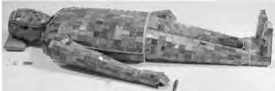
تصویر ۲- لباس تدفین شاهدختی در هوپه، سلسله هان، اواخر سده دوم قبل از میلاد، الواح یشمی دوخته شده با تار زرین، طول لباس، ۱۷۰ سانتیمتر. ماخذ: (گاردر، ۱۳۸۵، ۷۰۸)

قبل از آنکه به توضیح این اثر بپردازیم، بهتر است چند نمونه از اقدامات مهم دیگر این پادشاه را در دوران حکومت نه چندان طولانی اش برشماریم، که از آن جمله "تاسیس امپراطوری واحد چین" در ۲۲۱ قبل از میلاد، ایجاد وحدت در اوزان و مقادیر در سراسر چین و جایگزین کردن قوانین مملکتی به جای قانون های محلی در سراسر امپراطوری است" (حاتم، ۱۳۸۲، ۱۳۰).