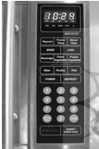
تصویر ۴ - نمونه ای از ساده کردن رابطه کاربر با محصول توسط طراح.

قابلیت های دیگری را داراست. طبعاً شناخت طرز کار با دستگاه، نقش مهمی در ایجاد رابطه و جلوگیری از سردرگم شدن کاربر ایفاء می کند. اگر طراح با "مدل ادراکی" ۷ استفاده گران آشین خانه، اجاق گاز سنتی و روند پخت آشنا باشد، در طراحی صفحه کلید های دستگاه مورد نظر، تقسیمات مناسبی ارائه می دهد. به این ترتیب با کمک رنگ ها، طرح های ساده و تقسیم بندی فضا های صفحه کلید، راهنمایی های لازم را به استفاده گران ارائه داده بنحوی که از مراجعه دائم به دفترچه راهنما خودداری کند (تصویر ۴). در چنین دستگاهی اگر با فشار دکمه ای فرمان دلخواه اجرا نشود به سادگی درک می شود که فرمان اجرا شده، غلط است.