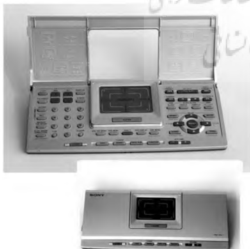
تصویر ۵ - مجموعه کنترل از راه دور در دستگاه ضبط سونی.

را نگه دار. پایه دوش به دیوار وصل بود؛ با کمی کنجکاوی فهمیدم که برای اتصال به دوش طراحی شده است" (Norman, 2004, 18). وی معتقد است مکالمه فوق بین طراح و استفاده گر صورت گرفته است. اگر پیشنهاد طراح توسط استفاده گر پذیرفته شود، از ابزار به همان شکل پیشنهادی طراح استفاده می گردد، در غیر اینصورت ابزار کنار گذاشته می شود. نورمن معتقد است نه تنها طراح، بلکه حتی کسی که شیء را از میان نمونه های مشابهش انتخاب نموده و در جایی مشخص می چیند نیز در حال طراحی کردن است. وی بر این باور است که در جایی مانند حمام، طراحان بسیاری همکاری دارند (اولاً در ساخت کلیه لوازم داخل آن، سپس انتخاب هر کدام از آنها و چیندن تمامی آنها به شکلی که دیده می شود). مکان فیزیکی اشیاء، ظاهر، صدا و لمس آنها، با استفاده گر حرف زده و اعمالی که قرار است انجام شوند را پیشنهاد می دهند. تأکید نورمن بر اینست که بعضی اوقات، وجود این مکالمه تصادفی است ولی در دستان یک طراح خوب، برقراری این ارتباط کاملاً عمدی است.