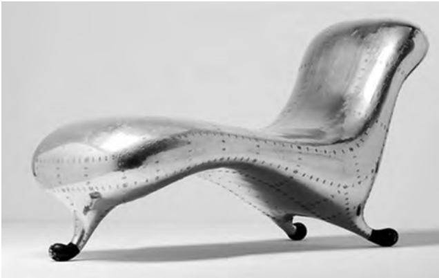
تصویر ۲- صندلی Lockheed Lounge LC2، اثر مارک نیوسون، ۱۹۸۸. ماخذ: (The best tables, chairs, lights, 2006)