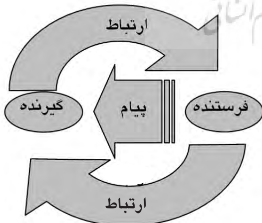
تصویر ۱ - چگونگی برقراری ارتباط از طریق محصول.

اما تعریف جامعی که می‌توان در این مقاله بدان استناد نمود این است که ارتباط یعنی "انتقال پیام از سوی فرستنده برای گیرنده، مشروط بر آنکه در گیرنده پیام، مشابهت معنی مورد نظر فرستنده پیام ایجاد شود." (محسنیان راد، ۱۳۷۸، ۴۲). بنا به این تعریف، در بوجود آمدن ارتباط همواره سه عنصر مهم نقش دارند: که عبارتند از فرستنده، پیام و گیرنده. بر این اساس، فرستنده پیامی را ارسال و گیرنده آن را دریافت می‌کند (تصویر ۱).