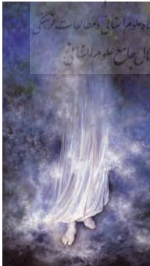
■ امید (خواهد آمد)

نقاشی ایرانی بیش از آن‌که با طبیعت مانوس و وابسته باشد، دل‌بسته‌ی گسترش اندیشه و عالم نامحسوس است که بی‌نهایت خیال را به حالتی دلپذیر تجلی و شکل می‌دهد و هنرمند برای این‌که تحولات و رنگارنگ زندگی مادی، یاری دستیابی به دنیای او را پیدا نکند، برای نموده‌های خود معنویتری فراتر از عوامل زندگی گذرا قایل می‌شود؛ زیرا هنری ماندگار و جاوید است که به مفاهیم انسانی و کلی وفادار باشد.