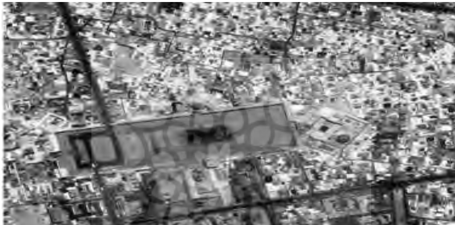
شکل ۳ میدان نقش جهان اصفهان، پلان مسجد امام در سمت راست تصویر و بافت شهری اطراف میدان ( http://civilica.persianguig.com )

سوی نظریه‌پردازی چون جیکوبز مبنی بر لزوم «تنوع کاربری و اختلاط آن‌ها در سطح شهر» مطرح شد. نمونه شاخص این پایبندی به اصول دفاع‌پذیری فضا- که کاربری اراضی در آن با تنوع و اختلاط مناسب مورد توجه قرار گرفته است- در شهر تاریخی اصفهان و یادگارهایی چند از دوره صفوی از جمله میدان نقش جهان به چشم می‌خورد. میدان نقش جهان اصفهان از فضاهای مهم شهری در معماری و شهرسازی ایران است.