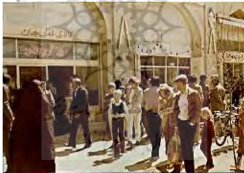
شکل ۴ محور بازار و بافت تجاری در جوار کاربری‌های متنوع تفریحی، مذهبی، گردشگری و... حول میدان ( http://vista.ir , http://tinypic.info )