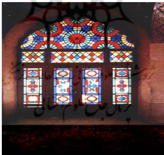
شکل ۲ نمایی از داخل یک فضای تاریخی که استفاده مطلوب از پنجره‌های مشبک را نشان می‌دهد

تعاملات اجتماعی بین ساکنان اهمیت داشته است. چنان‌که بررسی دقیق‌تر بافت تاریخی شهرهای سنتی، تلاش کالبد بافت را در جهت ایجاد نظارت همگانی و حفظ قلمرو طبیعی - که از پایه‌های اساسی ایجاد فضای قابل دفاع و نیز از اصول مهم نظریه‌های نیومن و جیکوبز به‌طور مشترک بوده است - نشان می‌دهد. کرو نیز در این باره می‌گوید برای ایجاد دسترسی مطلوب و کاهش دسترسی مجرمان می‌توان از نظارت‌های عمومی بر معابر و مسیرهای دسترسی بهره گرفت (خاموشی، ۱۳۸۷: ۱۵۶؛ Crow, 2000: 43-67). جهت‌گیری پنجره بناها به سمت معابر و میادین محلات بافت در واقع به دلیل افزایش میزان کنترل و پایش فضا از جانب ساکنان شهرهای سنتی در ایران است؛ معابری که در شهرهای کویری بافت کهن بنا بر ملاحظات اقلیمی اغلب دیوارهای بلند و عرض کمی دارند؛ این ویژگی اهمیت لزوم چنین مراقبتی را از فضا دوچندان می‌کند. این پنجره‌ها که گاهی در شکل پنجره‌های مشبک بسیار زیبا نمود پیدا می‌کنند، ضمن عهده‌دار شدن نقش کنترلی خود، محرمت فضاهای درونی ساکنان را که تمایل به حفظ آن را دارند، تأمین می‌کند.