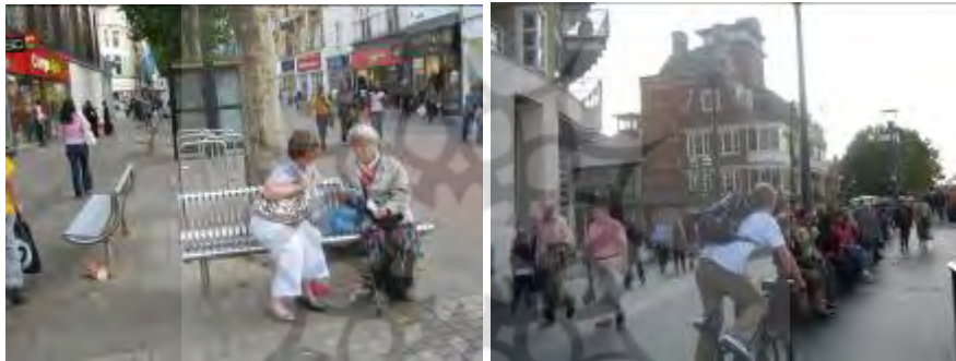
شکل ۱ افزایش سطح فعالیت در خیابان و فضاهای عمومی شهری

افزایش سطح فعالیت در خیابان و فضاهای عمومی شهری با پشتیبانی از سرمایه اجتماعی، کاربری پیاده را تشویق می‌کند و از میزان جرم و جنایت به‌طور محسوسی می‌کاهد (شکل ۱). اسکالومو آنجل ۱ ، یکی از پیشگامان اخیر CPTED، در رساله دکترای آنجل خود (۱۹۶۸) اذعان می‌کند: «محیط فیزیکی می‌تواند روی وضع جرم با تعیین قلمروها، کاهش یا افزایش دسترسی‌ها، با ایجاد یا حذف مرزها و شبکه‌های گردش، و با تسهیل نظارت توسط شهروندان و پلیس تأثیر مستقیمی بگذارد.» آنجل اثبات می‌کند میزان جرم به‌طور معکوسی با سطح فعالیت در خیابان‌ها مرتبط است (wikipedia, 2008).