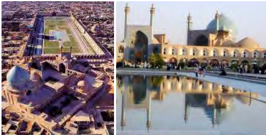
شکل ۵ نمایشی از میدان نقش جهان اصفهان که مسجد، مغازه‌های اطراف، حضور مردم و سایت میدان را در بافت کهن این شهر نشان می‌دهد