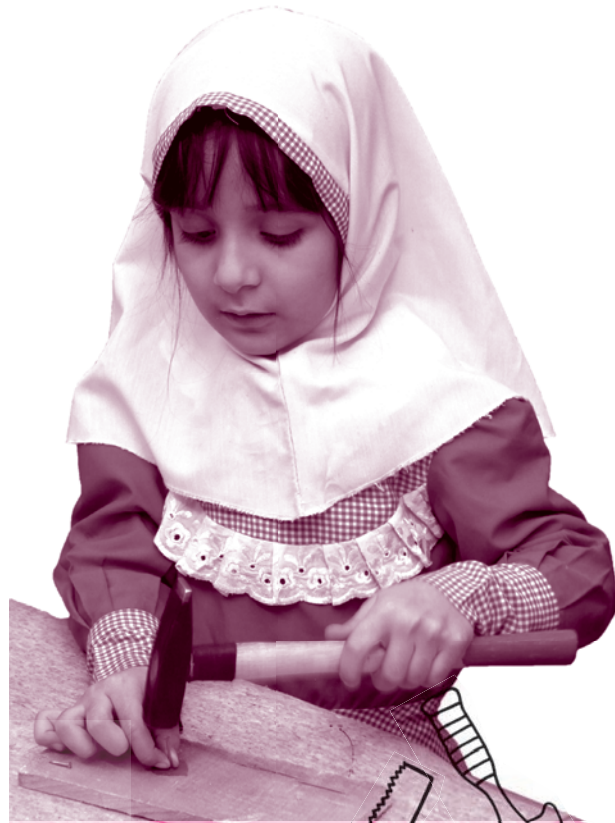
از مؤسسه فرهنگی آموزشی پیشگامان مدرسه فرادا