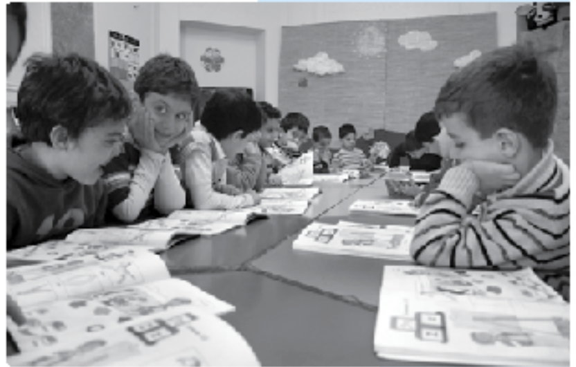
فضای خنوبی تصویرساز

مبنای فعالیت‌ها مشارکت فعال خود بچه‌هاست. در این کارگاه، انواع نمایش‌های عروسکی توسط مربیان یا نوآموزان اجرا می‌شود. فضای کلاس بر اساس موضوع واحد فعالیت هفته‌ای سه بار نمایشی را تعریف کرده و در پایان هفته هم یک گروه، نمایش را برای فضای کلاس اجرا می‌کند. برنامه‌ی زبان انگلیسی هم در این کارگاه و در هر هفته سه بار اجرا می‌شود.