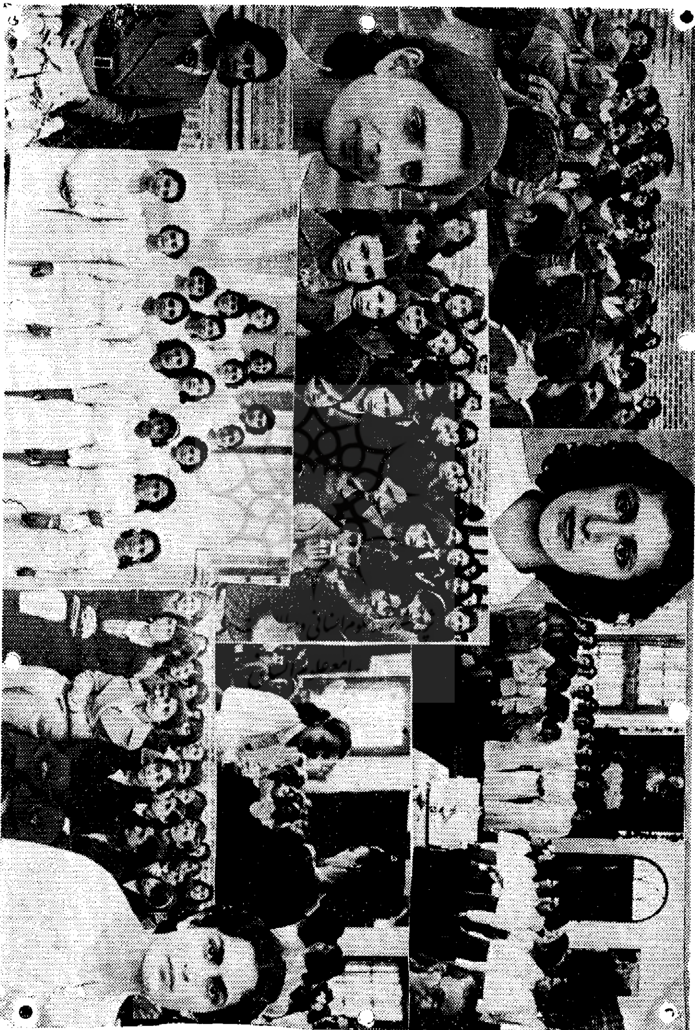
در جشنهای، تو زهر کو اهنه، نامه دبیرستانهای دختران