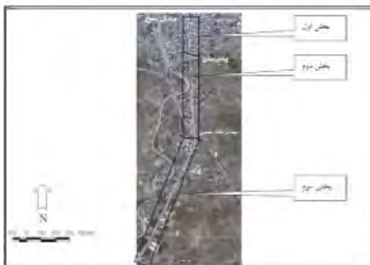
شکل ۱: مبادی ورودی شهر بابل از سمت بابل (محدوده‌ی مورد مطالعه) به تفکیک سه بخش