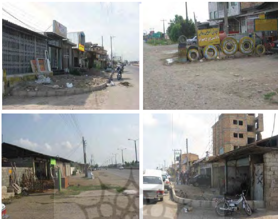
شکل ۲: استقرار کاربری‌های ناسازگار در جوار مبادی ورودی شهر بابلسر