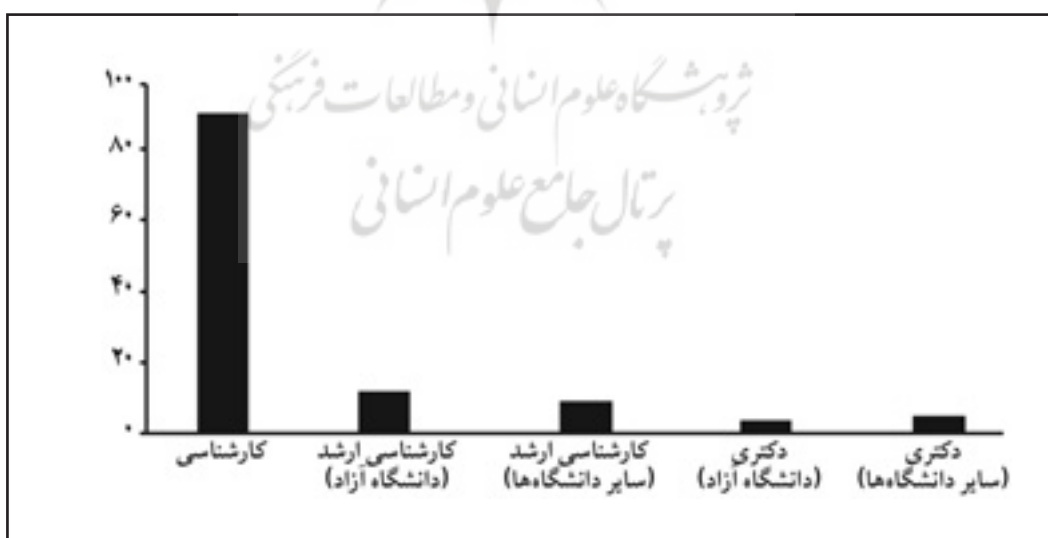
نمودار ۲-۳ تعداد پاسخ دهندگان بر حسب مقطع تحصیلی

ضمن اینکه ۳ نفر در مقطع دکترا تحصیل می کرده اند که یک نفر از آنها با مدرک کارشناسی ارشد از دانشگاه آزاد و دو نفر دیگر با مدرک کارشناسی ارشد از سایر دانشگاه ها بوده اند، دانشجویان مقطع کارشناسی با ۹۳/۲ درصد، بیشترین تعداد پاسخ دهندگان به پرسشنامه و دانشجویان مقطع دکترا از دانشگاه آزاد اسلامی