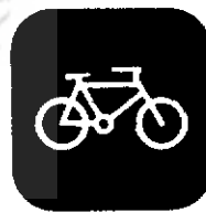
شکل ۲. نمونه‌ای از علائم هدایت کننده