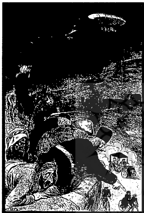
نمونه‌ای از طرح‌های ملا نصرالدین

این روزنامه در سال ۱۳۲۷ هـ. ق در شهر تفلیس انتشار یافت. قسمتی از این روزنامه به ترکی