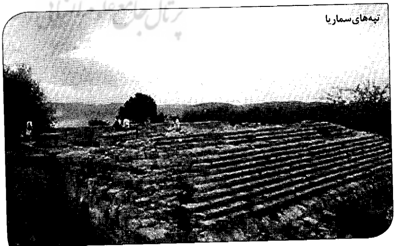
تپه های سماریا

امروزه نیم میلیون یهودی در زمین های زنگی می کنند که در جریان جنگ سال ۱۹۶۷ خاور میانه تصرف شده است. اکنون یک اجماع جهانی قدرتمند برای تشکیل یک دولت فلسطینی در غزه و کرانه باختری وجود دارد. مناطقی که چهار میلیون فلسطینی در آنها زندگی می کنند. بیشتر ساکنان یهودی کرانه باختری در مناطق حومه ای با خانه های شیک، زندگی بسیار مدرن و بزرگراه هایی که به اورشلیم و تل آویو