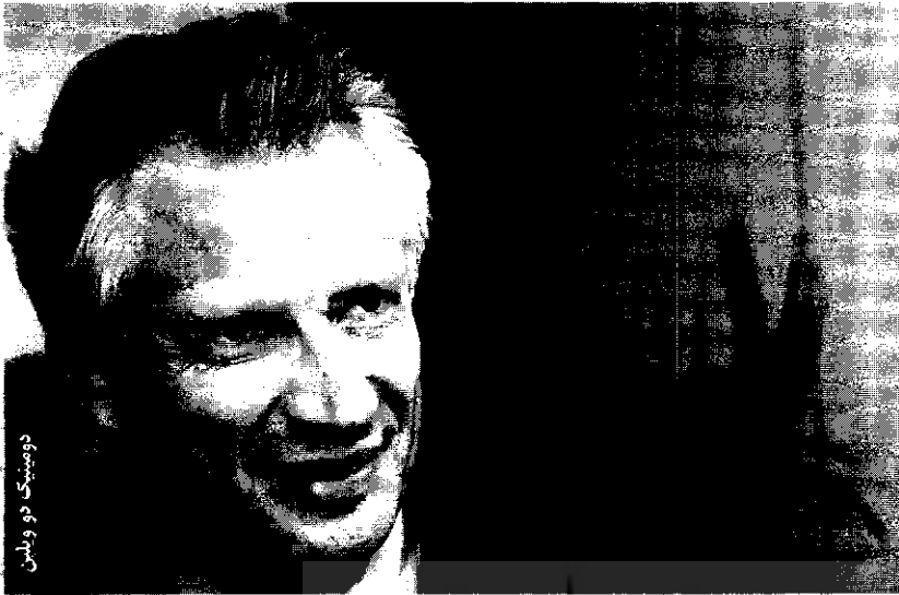
دومینیک دو ویلس

و به کارگیری سلسله‌ای از اقدامات امنیتی و بانکی قابل تحقق است.