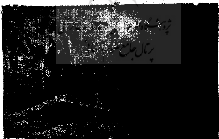
آرامگاه خدیجه زوجه رسول الله ص