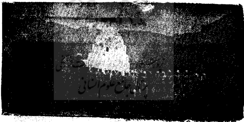
آرامگاه بنی هاشم و اعیان بی بی مریم در جنت البقی