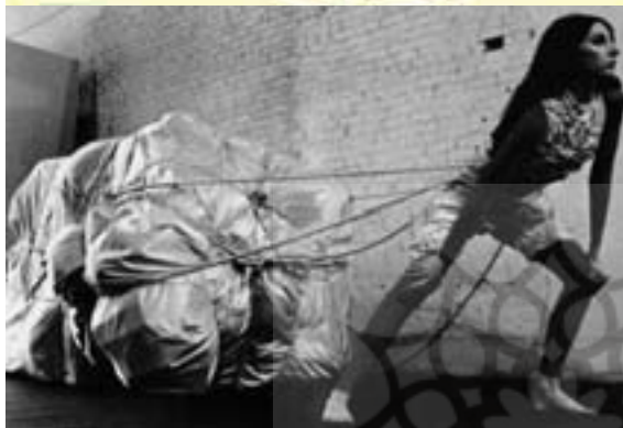
تصویر (۲) و (۳): کریستو، طراحی و اجرای لباس عروس برای افتتاحیه شوی لباس، ۱۹۶۷