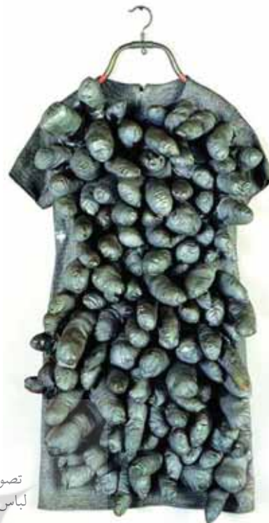
تصویر (۵): کوساما، لباس در سبک چیدمان

می کند. هدف او از این مجموعه، احضار ارواح خانم ها و لباس های گذشته توسط اشکالی متحرک است [Ibid, 63]. تصویر بعد، طرحی از یک لباس است که مفهوم "راز" را می رساند؛ راز به مثابه گنجی است در داخل یک کوله بار سنگین که فرد آن را بر دوش خود حمل می کند و می تواند سرچشمه نگرانی باشد، چه برای کسی که آن را در دل دارد و چه برای کسی که از برملا شدن آن می هراسد.