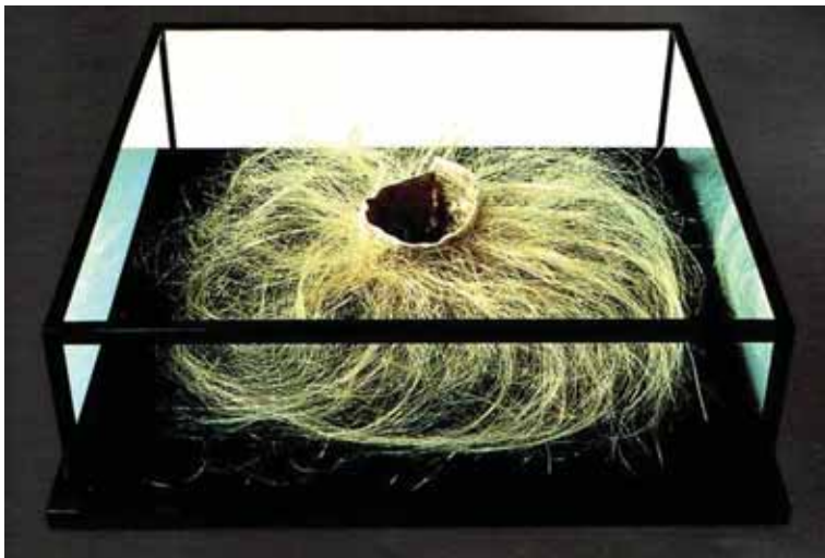
تصویر (۶): آن همیلتون، بدون عنوان، ۱۹۹۳