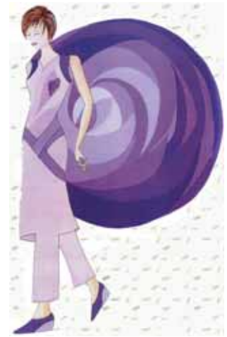
تصویر شماره (۸): راز، ۲۰۰۵

می کند و فنون برش و شیوه های ساخت لباس را دوباره تعریف می کند. بنابراین، باروش های جدید بیان، فرایندهای اندیشه ای به مجموعه او وارد می شوند. او می گوید: "من سعی می کنم تا به کارم پیشرفتی ثابت بدهم، هم از نظر مفهومی و هم از نظر زیبایی." این همان هدفی است که نسل تازه طراحان لباس در دنیا در پی آن هستند. هر چند از نظر سبک کار تفاوت های زیادی با هم دارند، شیوه های تازه ای را برای شکل دادن به افکار خود در قالب های بصری پیچیده جست و جو می کنند تا مفهومی جدید بیان کنند. شاید دیری نگذرد که شاهد تأثیرات لباس های مفهومی بر روی لباس های روزمره نیز باشیم. [2000 Harvey Nichols Magazine,