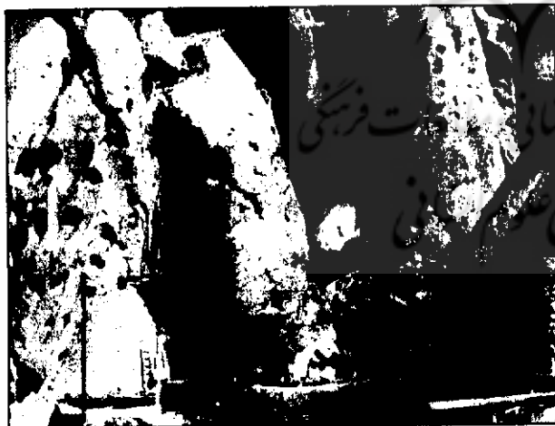
روستای کندوان، اسکو

اغلب کرانها دارای طبقات مختلف می‌باشند که دسترسی به این طبقات از راههای مشخص کنار کرانها صورت می‌گرفته و از داخل هیچگونه ارتباطی وجود ندارد. طبقات پائین عموماً به آغل گوسفندان و طبقات فوقانی به