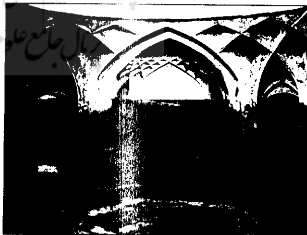
حمام گله داری، بندر عباس

حمام گله داری در محله اوزیها در ضلع غربی بازار اوزیها قرار گرفته است. این حمام متعلق به دوره قاجار و یکی از رقبه‌های