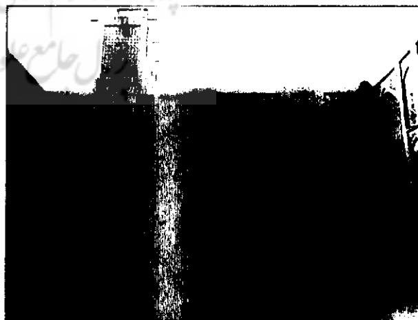
مسجد جامع خوزان-خمینی شهر

صحن طبقه زیرین حدود ۳/۷۰ متر از کف صحن مسجد پائین‌تر است و در اطراف آن غرفاتی احداث شده که مورد