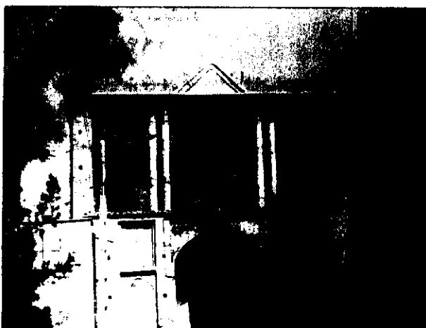
عمارت و باغ امیر، سمنان

مسجد گله داری است که توسط شیخ احمد گله داری بنیان نهاده شده است.