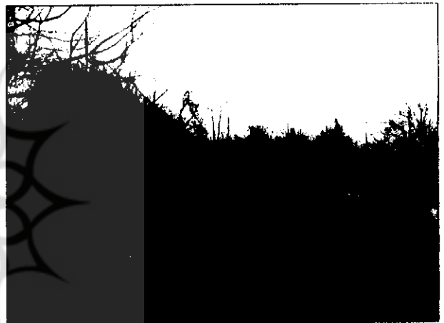
پل آزان، جویبار

این پل در روستای آزان از توابع جویبار، بر روی رودخانه