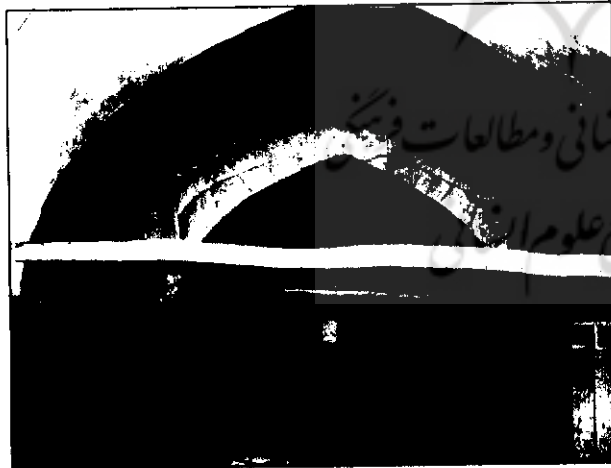
حمام گپ، خرم‌آباد

حمام گپ در محله بازار خرم‌آباد واقع شده و از خیابان مجاور