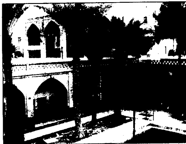
مسجد جامع باق

استفاده طلاب علوم دینی بوده و در حقیقت صحن زیرین در حکم حوزه علمیه و یا مدرسه بوده است. از لحاظ معماری سبکی شبیه مسجد آقا بزرگ کاشان را داراست.