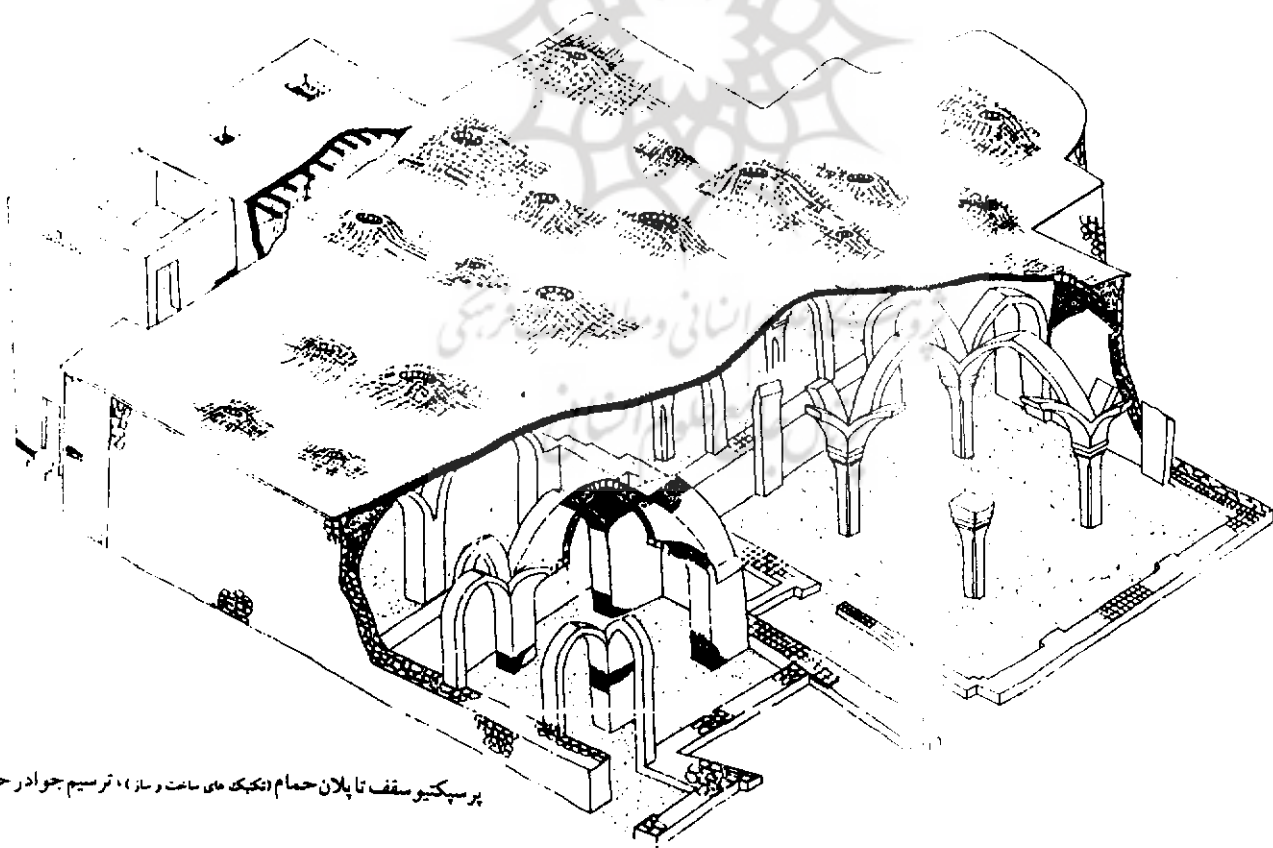
پرسپکتیو سقف تا پلان حمام (تکیه های ساعت و ساز)، ترسیم جوادر حتمی

پیگیریهای اداره بهداشت، به حمام دوشی تبدیل شد دو تا سال