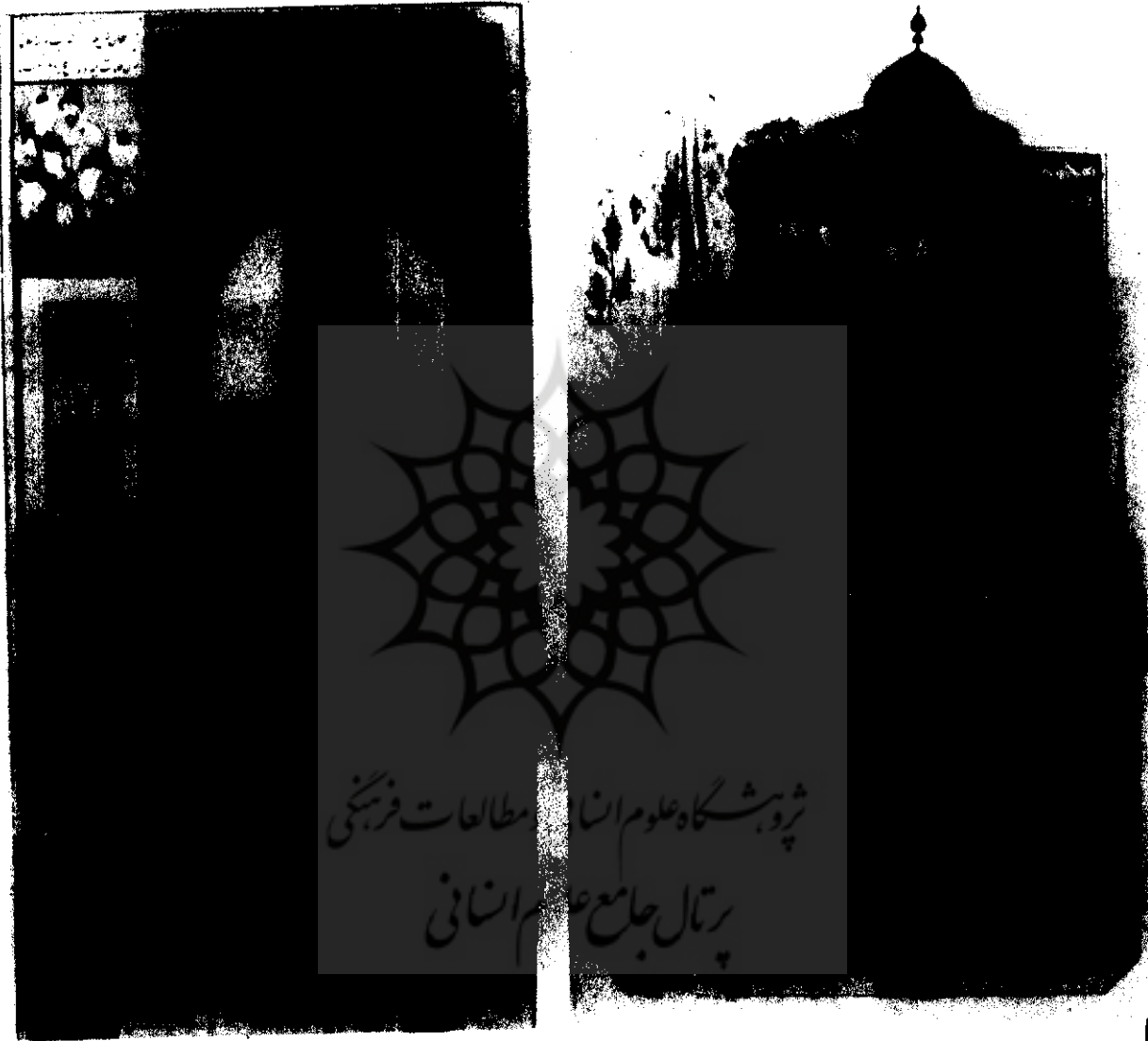
نمای درون مسجد - صفوی سبک تبریز - دیوان حافظ ۹۴۲ هجری

این کتاب شامل سه رساله و درباره طرز ساختن ساعت، آسیا و دستگاه روغن‌کشی نوشته شده، ویژگی این کتاب از نظر بحث مورد نظر در بیان چگونگی ساخت دو بنای مسکونی همراه با طرح و نقشه آنها می‌باشد. . . . "فایده طرح این عمارت اگر مختصر سازند، ایوانی می‌باید که پنج ذرع عرض آن باشد در هفت ذرع طول و اگر بزرگتر سازند، هفت ذرع عرض آن باشد در نه ذرع طول و اگر از آن عالی‌تر سازند نه ذرع عرض در ده ذرع طول و مسکن جهت مجاور آن مکان چنانچه طرح آن مصور می‌گردد و بلندی چکه طاق تا سطح زمین به هر یک از این سه طریق ده پانزده می‌باید تا مناسب یکدیگر باشند و مستحسن نمایند، بنابراین که معماران و مهندسانی که میانی این معانی وضع کرده‌اند، فرموده‌اند که