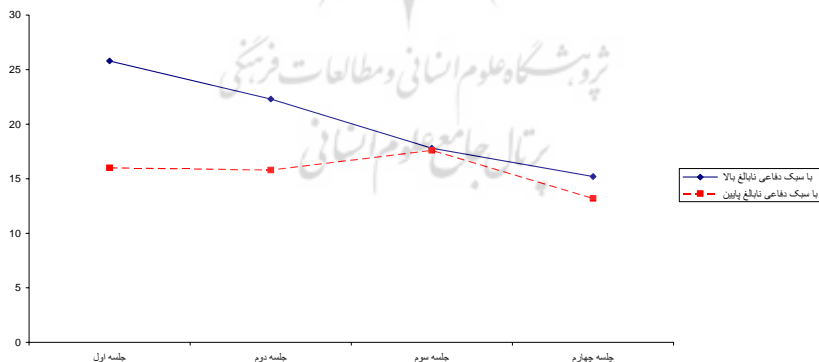
نمودار (۲): میانگین نمرات مربوط به مقاومت در دو گروه آزمودنیهای با سبک دفاعی نابالغ بالا و سبک دفاعی نابالغ پایین.

جدول (۵) نیز میانگین و انحراف معیار نمرات مربوط به این دو گروه و نمودار های ۲ و ۳ نیز نمودارهای مربوط به این میانگین ها را نشان می دهند.