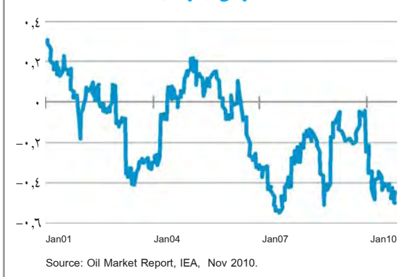
نمودار ۱ - همبستگی بین ارزش دلار و قیمت نفت خام وست تگراس اینتر مدیت

در اوایل ماه نوامبر ۲۰۱۰، بانک مرکزی آمریکا دور جدیدی از سیاست‌های انبساطی خود را برای تشویق اقتصاد این کشور اعلام کرد. این سیاست‌ها زمینه را برای افزایش قیمت نفت فراهم کرد. بانک مرکزی آمریکا اعلام کرده است تا اواسط سال ۲۰۱۱ به طور میانگین هر ماه ۷۵ میلیارد دلار از اوراق قرضه خزانه‌داری را خریداری خواهد کرد که مجموع آن به ۶۰۰ میلیارد دلار بالغ خواهد شد. با توجه به شایعاتی که قبل از اعلام این برنامه منتشر شده بود، پیش‌بینی می‌شد که این میزان به ۲ تریلیون دلار بالغ گردد. اما گرچه برنامه اعلام شده از شدت کمتری نسبت به آنچه پیش‌بینی می‌شد برخوردار است و دوره آن نیز طولانی‌تر است، اما به هر حال بازار نفت را متأثر ساخته است. زیرا این اقدام به معنی افزایش عرضه و کاهش ارزش دلار می‌باشد و کاهش ارزش دلار به افزایش