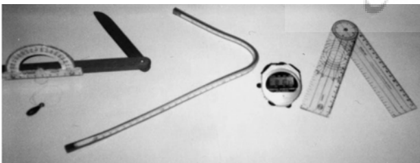
شکل ۱. خط‌کش قابل انعطاف و شیب‌سنج لگنی

بررسی راستاهای استخوانی مورد نظر بر روی نمونه‌ها توسط یک فیزیوتراپیست با تجربه در اندازه‌گیری‌های ذیل انجام شد. ابتدا، نقاط نشان‌گر ۵ استخوانی C_v ، T_{11} ، S_4 (۱۵-۱۳)، خار خاصه قدامی-فوقانی ۶ (ASIS) و خار خاصه خلفی-فوقانی ۷ (PSIS) توسط فیزیوتراپیست پیدا شد. سپس نمونه در حالت ریلکس با نگاهی به سمت روبرو و ۱۵ سانتیمتر فاصله بین پاها ایستاده و آزمونگر، خط‌کش قابل انعطاف ۸ (شکل ۱) را بر روی انحنای ستون فقرات پشتی و کمری فرد منطبق کرده و انحنای ایجاد شده در خط‌کش را به روی کاغذ منتقل می‌کرد. سپس برای اندازه‌گیری تیلت لگن، شیب سنج لگنی ۹ (شکل ۱) را روی ASIS و PSIS قرار داده و زاویه شیب لگن از راستای شاقولی بر روی نقاله خوانده می‌شد. برای محاسبه زاویه کایفوز از روش خلخالی (۱۶) و برای محاسبه زاویه لوردوز از روش دنیس (۱۷) استفاده گردید. تمام اندازه‌گیری‌ها در هر نمونه دو بار تکرار و از میانگین آنها برای داده‌ها استفاده شد. اعتبار و تکرار پذیری تمام روشهای اندازه‌گیری ذکر شده در این تحقیق در مطالعات پیشین محاسبه و خوب تا عالی گزارش شده‌اند (۱۹-۱۶).