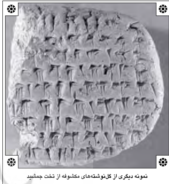
نمونه دیگری از گل‌نوشته‌های مکتوفه از تخت جمشید

۹. این گونه متن‌ها در بردارنده‌ی گزارش‌های سالانه یا گاه بخشی از سال یک شهر هستند (ص ۵۵).