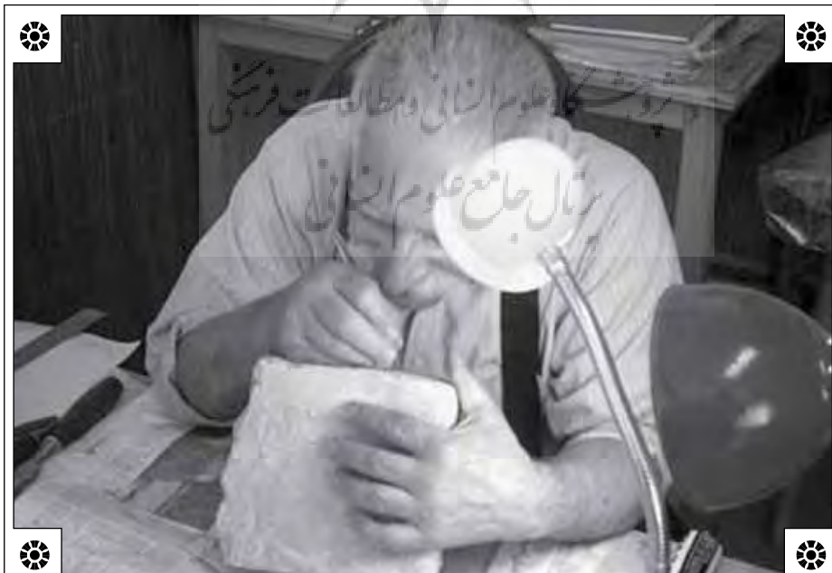
دکتر ارفعی در حال مطالعه خطوط باستانی

نویسنده در ادامه به شکل و اندازه گل‌نوشته می‌پردازد و اشاره می‌کند: «بیشتر گل‌نوشته‌های باروی تخت جمشید کم و بیش دارای شکلی یکنواختند... به‌طور کلی لبه‌ی چپ گل‌نوشته که محل نگهداری لوح با