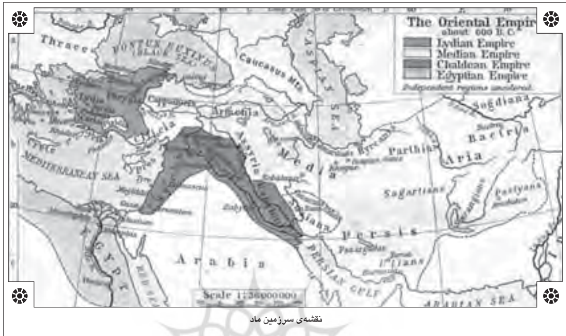
نقشه‌ی سرزمین ماد

نیز همواره در معرض بغض و کین قرار داشته و به ویژه پس از فروپاشی شوروی آماج حملات بیشتری قرار گرفته است.