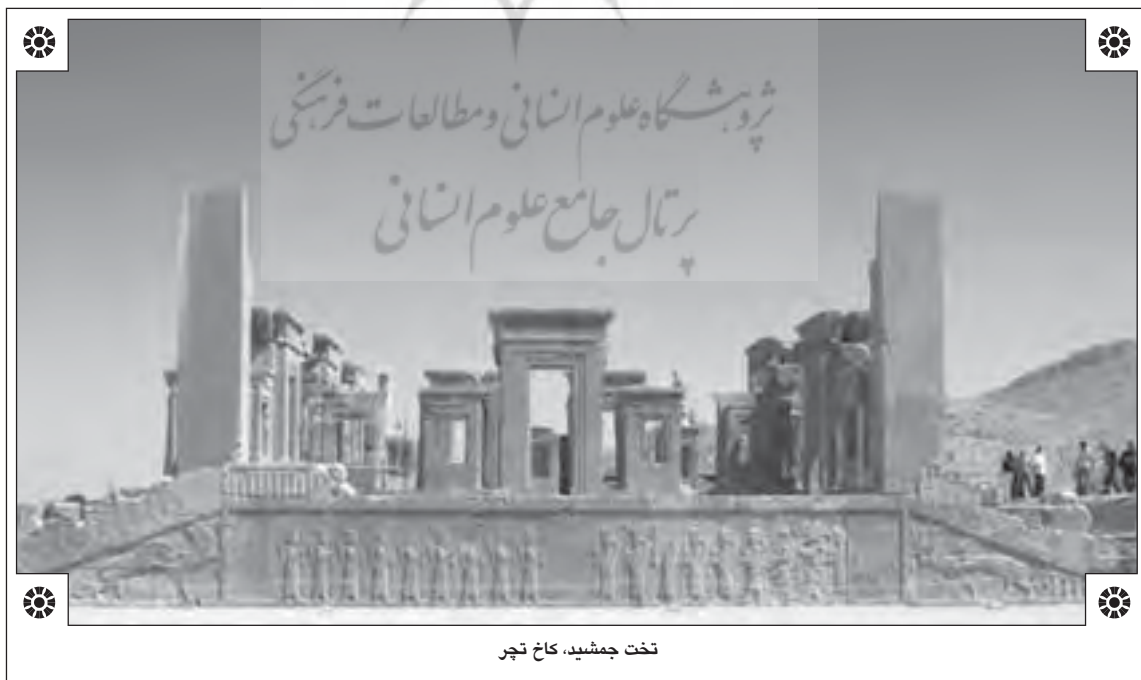
تخت جمشید، کاخ تچر

در خلال قرن هجدهم و آغاز قرن نوزدهم و به دلیل رشد علائق سیاسی و اقتصادی بریتانیا به ایران و گسترش روابط سیاسی بین این دو کشور بر تعداد سیاحان باستان‌شناس بریتانیایی و بعد فرانسوی در ایران افزوده شد و با زدید از آثار و مکان‌های تاریخی ایران خصوصاً تخت جمشید، پاسارگاد و