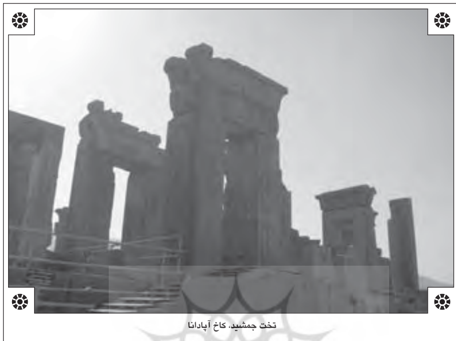
تخت جمشید، کاخ آپادانا

باستانی فراوان از سرزمین‌های تحت سلطه‌ی ایرانیان در پیش از اسلام که در بعضی دوره‌ها تقریباً شامل تمامی سرزمین‌های آسیای غربی و شمال آفریقا می‌شد، باعث گردید که تاریخ‌نگاری ایران توسط غربی‌ها به تدریج از شیوه‌ی پیشین یعنی یونانی‌گرایی فاصله بگیرد.