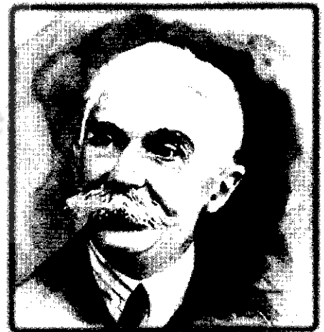
بارون پیردوکوبرتن مؤسس کمیته بین المللی المپیک

بر اساس همین تفکر، کوبرتن همراه همفکرانش، در روز ۲۳ ژوئن سال ۱۸۹۴، طی نشستی در دانشگاه سوربن پاریس، کمیته بین المللی المپیک ۴ را تأسیس کردند. کوبرتن اعتقاد داشت که باید سازمانی بین المللی در ورزش تشکیل داد تا از