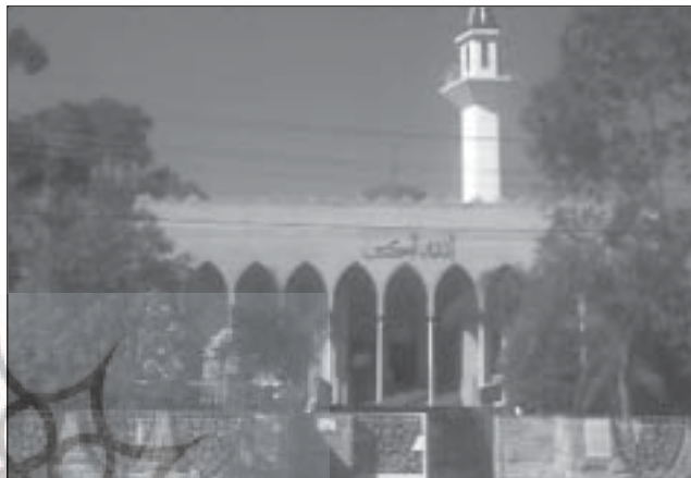
مسجد لاکمبا، لاکمبا، نورث ساوت ولن، استرالیا

با توجه به تحولات فزاینده مهاجران مسلمان بویژه پدیده انقلاب اسلامی ایران و وجود همسایگان پرجمعیت و مقتدر همسایه آن مانند اندونزی بوده است.