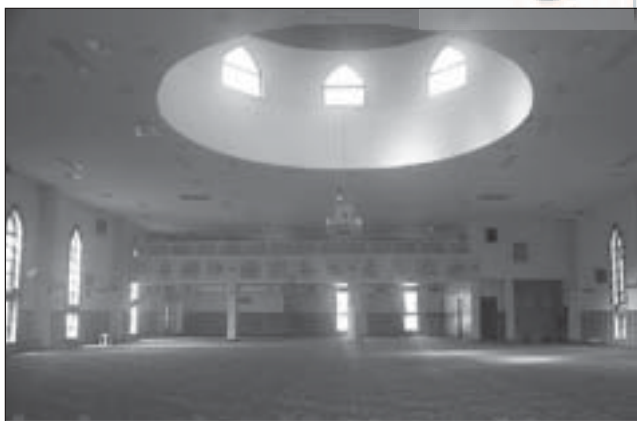
مسجد لاکمبا، لاکمبا، نورث ساوت ولز، استرالیا

«کالیفات» بود. این کاروان تحت نظارت «ویتر» بود که همواره در خاطراتش بر نقش سرنوشت ساز «بیجا درویش» در رسیدن این کاروان به مقصد و نجات از هلاکت و نابودی تأکید کرده است.