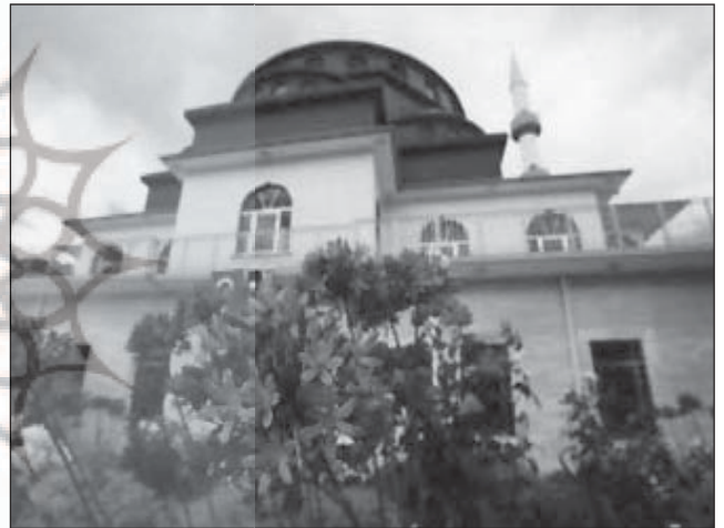
مسجد آبورن، پارادای شمالی، نورث ساوت ولز، استرالیا

براساس آمار ۱۹۹۶ م. تعداد کسانی که بی دین بوده اند ۱۶/۶ درصد و تعداد کسانی که دین خود را اعلام نکرده اند ۹ درصد