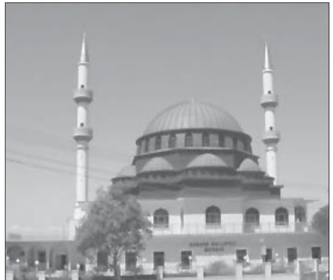
مسجد آبورن، پارادای شمالی، نورث ساوت ولز، استرالیا

از کسانی که نام خود را در تاریخ استرالیا جاویدان ساختند، «بیجاه درویش» است که رئیس ساربانان در کاروان اکتشافی