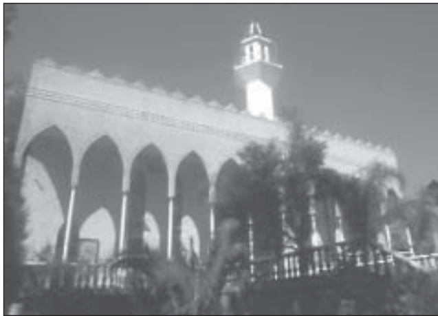
مسجد لاکمبا، لاکمبا، نورث ساوت ولز، استرالیا

در جامعه استرالیا نسبت به دین اسلام شناخت خوبی وجود ندارد و در برخی زمینه ها سوء تفاهم وجود دارد. در این زمینه نخستین اقدامی که میان مسلمانان و غیرمسلمانان صورت گرفت گردهمایی ۱۶ نوامبر ۱۹۹۱ م. میان نمایندگان فدراسیون شوراهای اسلامی و کلیسای متحده در استرالیا بود که هدف از آن، شناخت و درک بهتر از مسیحیت و اسلام عنوان گردید [«Building on», 41]. و هر دو گروهها به عدم شناخت یکدیگر در جامعه چند فرهنگی استرالیا اشاره داشتند. همچنین در این سمینار نمایندگان ادیان اسلام و مسیحیت در استرالیا بر روی مفاهیم اصلی و اعمال مذهبی دین خود بحث کردند که این موضوعات مطرح شده کوشش به منظور شناخت هویت و دیدگاه متفاوت آنان برای حصول به نتیجه ذکر گردید.