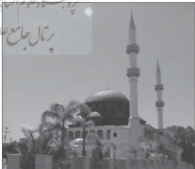
مسجد آبورن، پارادای شمالی، نورث ساوت ولز، استرالیا

در خصوص مراکز اسلامی اطلاعات دقیقی در دسترس نیست زیرا همواره در حال تأسیس یا حذف هستند. اما مهمترین سازمان و تشکیلات مذهبی در استرالیا موسوم به افیک یا «فدراسیون شوراهای اسلامی» است که نمادی از امت اسلامی در میان جامعه مسلمانان به شمار می‌آید و همانند چتری مراکز اسلامی و مساجد را در حیطه دارد. این فدراسیون با دولت استرالیا رابطه دارد و می‌تواند مستقیماً با وزیر مهاجرت و امور فرهنگی ارتباط برقرار کند. نقش این سازمان، هماهنگ کننده انجمنها و شوراهای اسلامی در سراسر