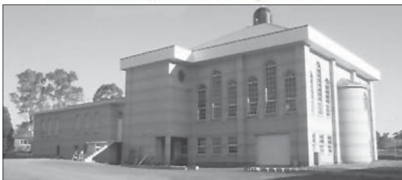
مسجد بانی ریج، نورث ساوت ولز، استرالیا

آنچه قابل تأمل است این است که، عمده پژوهشهای حاضر از سوی اداره مهاجرت استرالیا به صورت پروژه های تحقیقاتی در اختیار پژوهشگران قرار گرفته است و پژوهشگران کمتر به صورت مستقل و بر اساس علائق و زمینه های موجود توانسته اند ابعاد گوناگون مرتبط با جامعه مسلمانان را روشن کنند و نیز، تعداد اندک مراکز پژوهشی در خصوص شناخت ارزشها و بینشهای مذهبی و رسوم دینی اقلیتهای استرالیا به خصوص درباره مسلمانان،