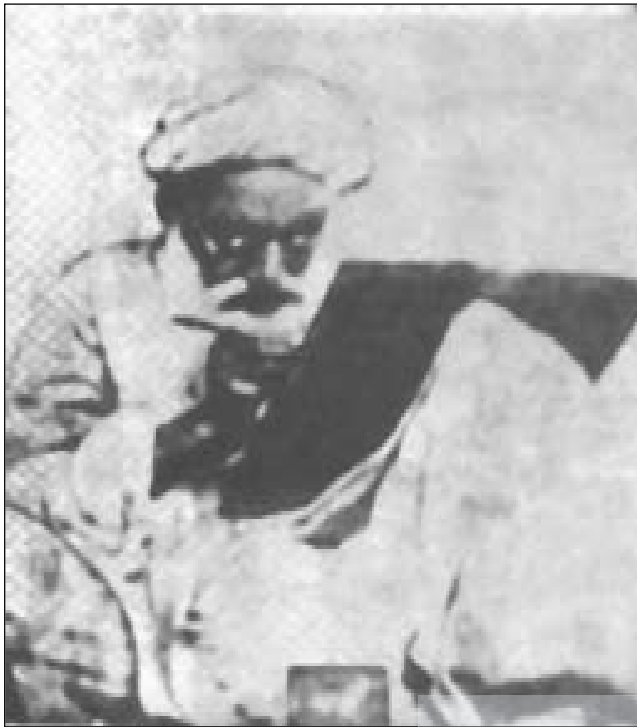
آیت الله میرزا محمد تقی شیرازی

در دوره رضاخانی با توجه به خفقان و فضای وحشت که بر ایران حکومت می کرد، آیت ا. . . سید هاشم میردامادی در دفاع از اسلام سخت و بی پروا بود. در حادثه مسجد گوهرشاد به سال ۱۳۱۴، ایشان و دیگر علمای مشهد، در منزل آیت الله سید یونس اردبیلی جلسه ای تشکیل دادند و با صدور اعلامیه ای تند از عملکرد حکومت وقت و شخص رضاخان اعلام انزجار کردند. بعد از آن جلسه، ایشان به سمنان، و دیگر علمای حاضر در جلسه، به مناطق دیگر تبعید شدند. بعد از گذشت حدود هفت سال از تبعید ایشان به سمنان، آیت ا. . . سید هاشم میردامادی تصمیم گرفت از سمنان فرار کند و به مشهد مقدس برگردد. معظم له به طور بسیار سری و مخفیانه، اثاثیه منزل را فروخت و برای حرکت در شب، برای همه کفشهای کتانی بدون صدا و چند کسبه نان تهیه کرد. متأسفانه، شب هنگام در بین راه، مأموران وقت از حرکت ایشان و خانواده معظم له جلوگیری کردند. بدین ترتیب، ایشان مجدداً به سمنان بازگشت و مدتی دیگر را در حبس سپری کرد.