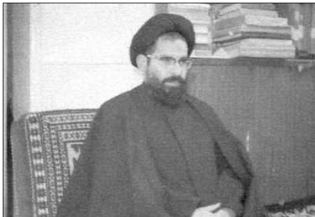
آیت الله سید حسن میردامادی

الهی ایشان، در خاطر مردم مشهد از یاد نرفته است.