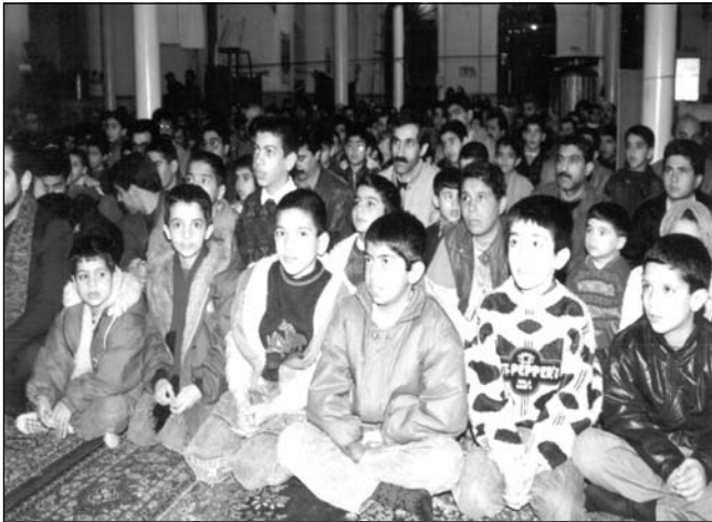
مسجد ابوذر، تهران

و امور آنها نظارت می کند. ۵. انتخاب هر ساله مسجد نمونه و مدیران نمونه مساجد، و معرفی فعالیتهای مساجد کشور از طریق رسانه های گروهی.