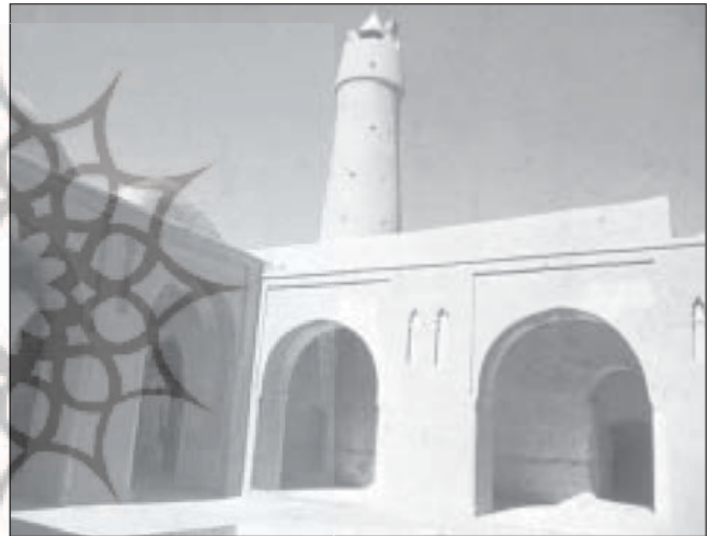
مسجد جامع فهرج، یزد

تعطیلی مساجد در جمهوریهای مسلمان نشین آسیایی به وسیله حکومت کمونیستی، و اقداماتی علیه مسجد در کشورهای مثل ترکیه، از نمونه‌های بارز اسلام‌زدایی معاصر است که در کنار دیگر ممنوعیتها و محدودیتهای مذهبی صورت می‌گرفت. پیش از این، در ایران نیز طراحی بعضی از مساجد، با ظواهر غیراسلامی انجام می‌شد. مسئله اشرف مسجد در برابر بناهای دیگر، در طراحی شهرهای