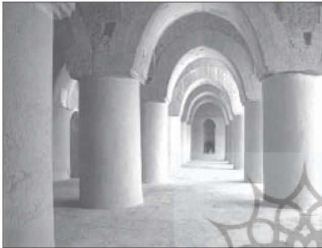
مسجد تاریخانه، دامغان

به وسیله مساجد، آیات قرآن کریم در معرض دید مؤمنان قرار می‌گیرد. یکی از عرفا و فلاسفه اسلامی در تفسیر حروف قرآن، چنین نوشته‌اند: «هر حرف قرآنی، سه صورت دارد؛ صورت گفتاری که به گوش می‌رسد، صورت نوشتاری که به چشم می‌آید، و صورت اصلی یا روحانی که جایگاه ظهور آن قلب است». مسلم است که صورت روحانی قرآن، از دریچه چشم و گوش در قلب جای می‌گیرد.