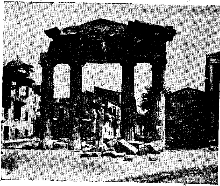
خرابه بازار آتن

تنها مزیت عقلی که من بسر دیگران دارم اینست که میدانم نادانم ولی دیگران تصور میکنند انا هستند در صورتیکه آنها نیز حقیقه نادانند .