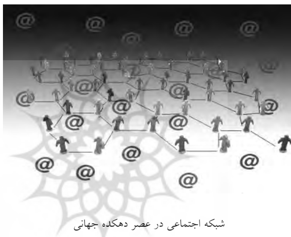
شبکه اجتماعی در عصر دهکده جهانی

کشورهای پیشرفته است. این تحول سبب شده که گاه خبرهایی که رسانه‌های رسمی به آن توجه نشان نمی‌دهند، ظرف چند ساعت به شیوه‌های غیر رسانه‌ای همچون وبلاگ‌ها و اس ام اس در سراسر شبکه اجتماعی توزیع شود.