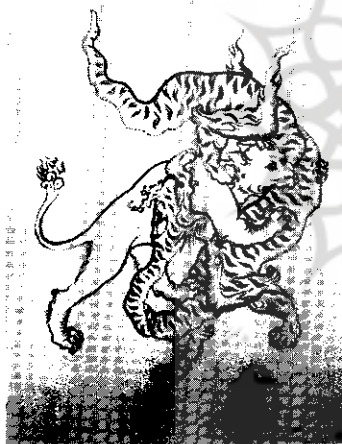
اثر : مرحوم استاد حاج مصدرالملک

رشد آموزش هنر دوره پنجم / شماره چهار تابستان ۱۳۸۷