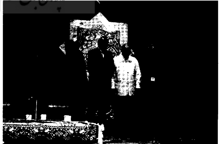
همایش گنجینه‌های از یاد رفته . فرهنگستان هنر تهران