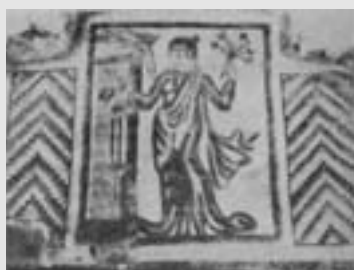
نقش‌های سرامیکی کاخ بیشاپور

چند شهر دیگر ایران بود. تا دوران سلجوقیان کاشی مورد استفاده‌ای در زیباسازی بناها نداشت تا این که در این زمان از قطعات کاشی رنگی و ترکیب آنها در کنار هم نقش‌هایی بوجود می‌آوردند و در نماسازی از آنها استفاده می‌بردند این روش در دوره ایلخانان با استفاده از اشکال هندسی کاملتر گردید تکمیل این دو روش به مرور هنر معرق کاری را بوجود آورد که دوران‌های مختلفی را به خود دید تا این که اوج آن را در دوره صفویه مشاهده می‌کنیم که تا امروز نیز ادامه دارد در این زمینه شهرهای اصفهان و مشهد سرآمد دیگر شهرهای ایران است. همزمان با پیشرفت تهیه لعاب، نقاشی و لعاب زنی بر روی سطوح صاف سفال که آن را کاشی می‌نامیم رواج یافت اندازه‌های این سطوح از ۳۰×۳۰ سانتی متر تا ۱۵×۱۵ سانتی متر متغیر بود. این هنر با پیدایش رنگ‌های اکسیدی در لعاب کاملتر گردید که مسجد کبود در تبریز ساخته شده به سال ۸۷۰ هجری قمری در دوران تیموریان نمونه زیبایی از این دوره است در دوره‌های بعدی نیز کار کاشی هفت رنگی و معرق و استفاده از آنها در نماسازی ساختمانها به خصوص بنای مساجد و مدارس رونق گرفت که در دوران صفویه به اوج خود رسید. استفاده از حدود چهل تا پنجاه هزار متر کاشی هفت رنگی در مسجد شاه اصفهان نمونه روشنی از این پیشرفت است. هنر کاشی سازی و کاشی کاری با این پیشینه کهن هنوز هم در ایران رواج دارد که امروزه با استفاده از وسائل و روش‌های جدید تا حدودی آسانتر از گذشته انجام می‌شود