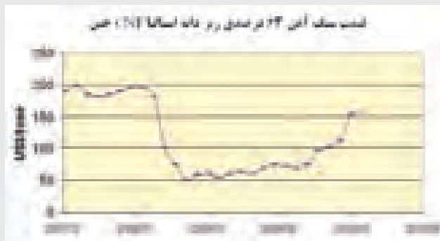
نمودار شماره ۲ تغییرات قیمت سنگ آهن ریز دانه ۶۳ در صدی استرالیا جهت صادرات به چین طی سالهای ۲۰۰۸ تا نیمه آوریل ۲۰۱۰

در این میان سهم چین در این تغییر و تحولات بازار بسیار چشمگیر است. به نحوی که سوداگران صنایع وابسته به فولاد، به طرز عجیبی اخبار و تحولات این صنعت در چین را پیگیری می نمایند. عده ای معتقدند این تغییرات