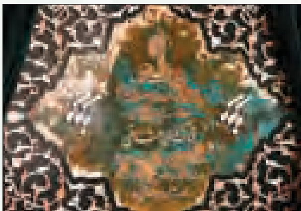
لوح یادبود افتتاح بورس کشاورزی که متأسفانه این روزها دیگر ارزشی ندارد!

کمک به توسعه بخش کشاورزی بر پایه رشد و افزایش سرمایه گذاری به ویژه توسط بخش خصوصی در این حوزه از اقتصاد به همراه توسعه صادرات محصولات کشاورزی، یکی از مهمترین اهداف و دورنمای بورس کالای کشاورزی است که حصول به آنها تاثیر بسیار شگرفی در اقتصاد کشور به اشکال افزایش اشتغال، تولید ملی و صادرات غیر نفتی و نهایتاً ورود ارز به کشور خواهد داشت.