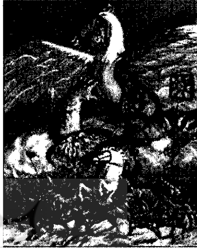
دوره دوم ، شماره ششم ، هفتم ، هشتم هزار و سیصد و هشتاد و دو

به جان دوست که در اعتقاد سعدی نیست که در جهان به جز از کوی دوست جایی هست