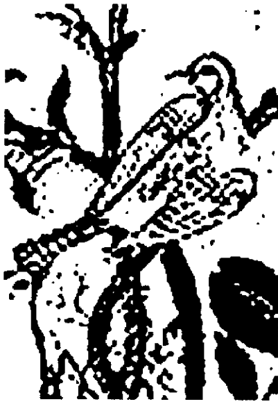
دوره دوم، شماره ششم، ماقم، هشتم مزار و سپهسوهشتاد و دو

اسطوره و دین می‌گویند که در مینو آرامش و سکون است. در جایی که گردش ماه و خورشید و ستارگان نباشد حرکت نیست و زمان نیست. و آن جا که زمان و حرکت نباشد همه‌ی زمان‌ها یک زمان - دمی جاودان و در برگیرنده‌ی آغاز و انجام است و همه‌ی جاها (با نبود حرکت و از میان رفتن فاصله) ناکجایی یگانه که در جام جهان نما می‌توان دید.