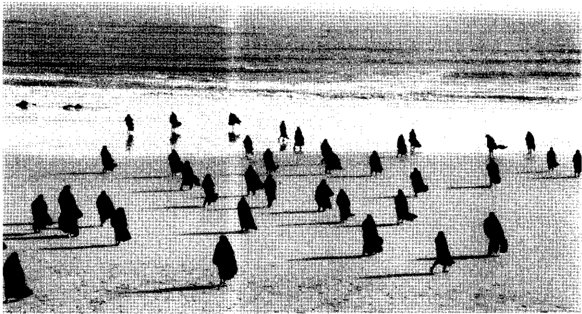
نوری نوب شماره دهم و هنر و معماری و هنرستان ید

است، زیرا که به نقد اجتماع می پردازد، بدون این که ادعای آن را داشته باشد. به نظر من فیلمسازان ایرانی رویکرد جدیدی را کشف کرده اند که به علت فقدان شدید امکانات رشد می کند و آثاری مهم با معنایی جهانشمول می آفریند.