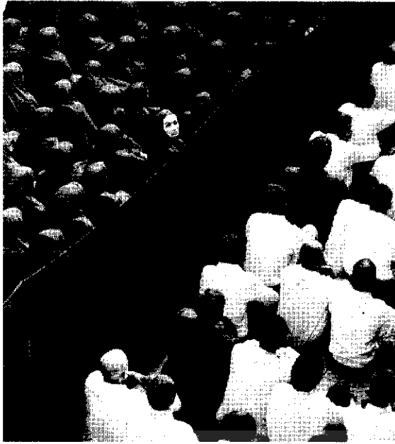
تورجی نوم شماره بخودو هزار و سیصد و هشتاد و یک

است ، گرچه اغلب این زنان هستند که مورد تحریم قرار می گیرند. بنابراین در این پروژه مردان و زنان دیگر در دو صحنه ی متقابل نمایش داده نمی شوند، بلکه روی دو صحنه ی مجاور به نمایش درمی آیند. [ در مراسم درون فیلم هم ] به همان اندازه ی داستان رومئو و ژولیت در غرب مشهور است . گرچه یک پرده مردان و زنان را جدا می کند ، آن ها نزدیک یکدیگر هستند . و در حالی که در عصیانگر و جذبه تماشاگران مجبورند مناوایا توجه شان را به عقب و جلو منحرف کنند و به هر دو جانب بپردازند ، در این جا آن ها به توزیع یکسان توجه شان واداشته می شوند .