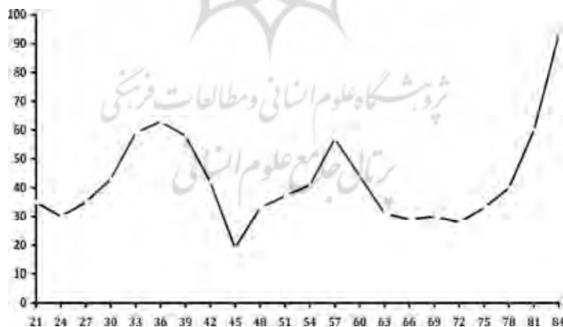
نمودار ۱: تعداد بازارهای بورس آتی آمریکا

این عامل، اصلی‌ترین دلیل موجودیت قرارداد آتی‌ها بر روی یک دارایی پایه است؛ زیرا اگر کالا قیمت ثابت و یا نوسان کم داشته باشد، توجیهی برای پوشش نااطمینانی آن و یا سفته‌بازی بر روی آتی‌های آن کالا وجود ندارد. بر اساس نمودار شماره ۱، در آمریکا دو دوره زمانی وجود دارد که بازارهای آتی به شدت با رشد روبه‌رو شده است. بین سال‌های ۱۹۲۸-۱۹۳۵ و ۱۹۷۸-۱۹۸۳، در دوره اول، ایجاد بازارهای آتی جدید به لحاظ تعداد ۲۳ درصد و در دوره دوم، ۱۵ درصد رشد داشته است. ویژگی اصلی در هر کدام از این دوره‌ها - که اولی مصادف با بحران بزرگ است و دومی نیز مصادف با بحران نفتی ۱۹۷۳ اعراب و ۱۹۷۹ انقلاب ایران و نیز بحران مالی ۱۹۷۸ است - نرخ‌های تورم بالا و در نتیجه، افزایش عدم اطمینان قیمتی کالاهای مختلف می‌باشد. با محاسبه همبستگی بین نرخ تورم و نرخ رشد بازارهای آتی در آمریکا به عدد ۲۶ درصد می‌رسیم که نشان از همبستگی بالای این دو متغیر دارد. البته باید گفت که این همبستگی برای تمام کالاها برابر نیست. برای مثال، یک درصد افزایش نرخ تورم باعث ۹ درصد افزایش در قراردادهای جو و ۶ درصد در گندم شده و تقریباً هیچ تغییری در قراردادهای سویا به وجود نیامده است (کارلتون، ۱۹۸۴).