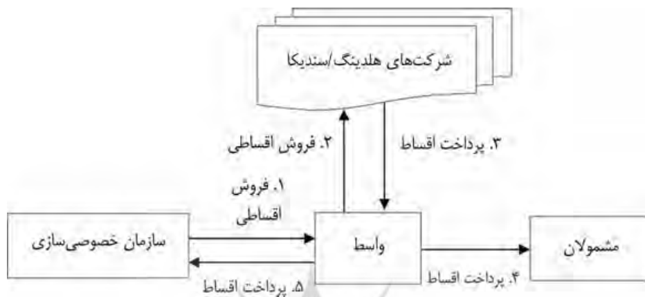
نمودار ۴: مدل عملیاتی شماره دو

خصوصی‌سازی، بقیه را به مضمولان واگذار می‌نماید. فرآیند عملیاتی انتشار این اوراق در نمودار زیر آورده شده است.