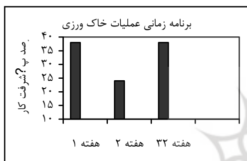
نمودار ۱- برنامه زمان‌بندی شده عملیات زراعی