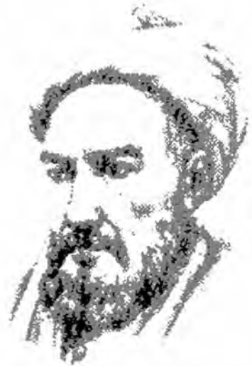
خواجه نصیرالدین طوسی

آن، ذهن از علم به معلوم سابق به علم به مجهول منتقل می‌شود. پس در این‌جا چیزی هست که کارش افاده علم به مجهول تصویری است و چیزی هست که کارش افاده علم به مجهول تصدیقی است. پس غایت علم منطقی، این است که تنها این دو چیز را به ذهن بفهماند، یکی این که انسان بداند گفتار تصور چگونه باید باشد تا معرفت حقیقت ذات شیء شود و دیگر این که بداند گفتار تصدیق آفرین چگونه باید باشد تا تصدیق یقینی ایجاد کند. ۲۴