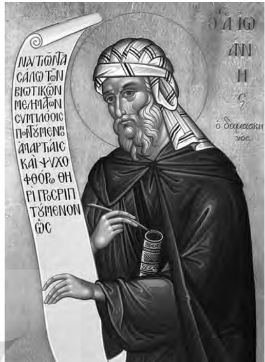
قدیس یوحنا دمشقی

آمبروس، برهان از نوع حجت و استدلال را. توماس می‌گوید: برهین منطقی و استدلال‌های عقلی در اثبات حقایق وحیانی و ایمانی نامعتبرند، لکن همچون قدیس گریگوری اعتقاد دارد که این استدلالها و برهین می‌تواند راهگشای ایمان باشند، هر چند وحی جنبه ایمانی دارد لکن چون ایمان خود مبتنی بر عقل است می‌توان از طریق عقل به ایمانی مطمئن‌تر و یقینی‌تر نایل شد. زیرا عقل میزان و محک ایمان است. او همچنین به این سخن پولس رسول استشهد می‌کند که: «هر فکر و اندیشه‌ای را به اطاعت مسیح درآورید» ۸ و نتیجه می‌گیرد که تعلیم مقدس می‌تواند از حجیت فلاسفه استفاده نماید، اما با این حال تأکید می‌کند که حجیت فلاسفه از نوع برهان ظنی و احتمالی است و ضروری است که تعلیم مقدس از حجیت اصول وحیانی‌اش، یعنی حجیت متون شرعی به عنوان برهان ضروری استفاده نماید. وی در آخر بحث می‌افزاید، حتی حجیت آبی کلیسا را نیز نمی‌توان به عنوان یک برهان ضروری به کار گرفت. زیرا تنها حواریون و رسولانند که حامل واقعی وحی به شمار می‌آیند.