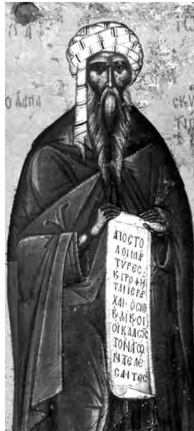
قدیس یوحنا دمشقی

اعتراض اول: اموری که در علوم پست تر وجود دارند، شایسته علم برتری، مانند تعلیم مقدس نخواهند بود. اما در شعر که از پست‌ترین علوم است، از تشبیهات و تصویرها استفاده می‌شود. بنابراین شایسته نیست که این تعلیم از چنین اموری استفاده نماید.