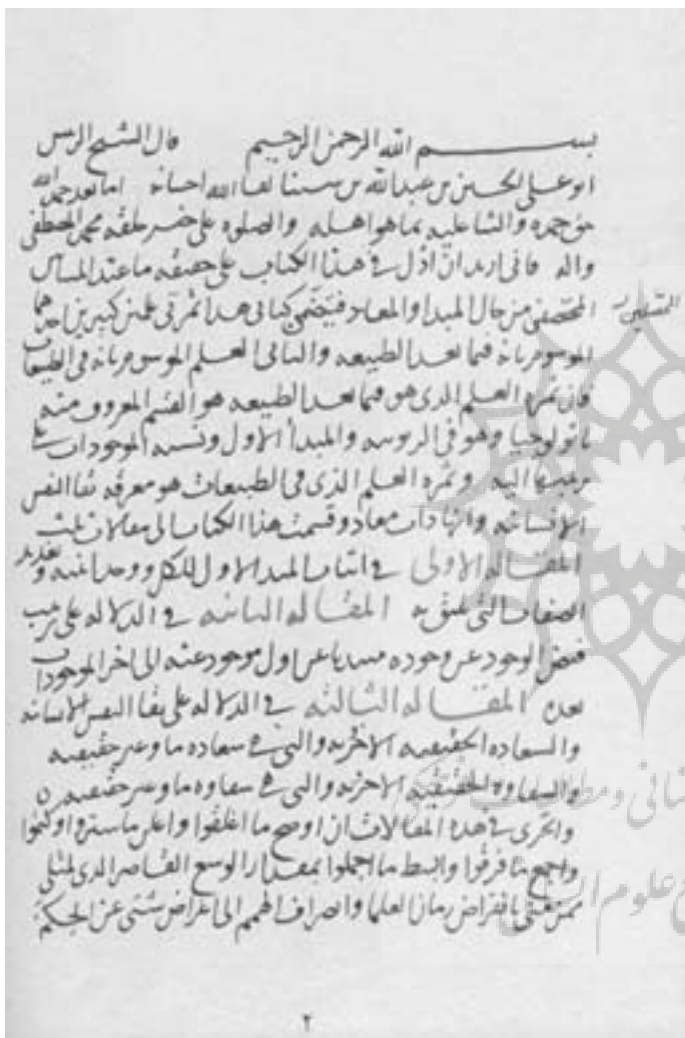
نسخه خطی رساله المبدأ و المعاد ابن سینا

نسخه خطی آن به شماره ۲۷۶۳ در کتابخانه نور عثمانیه استانبول موجود است.